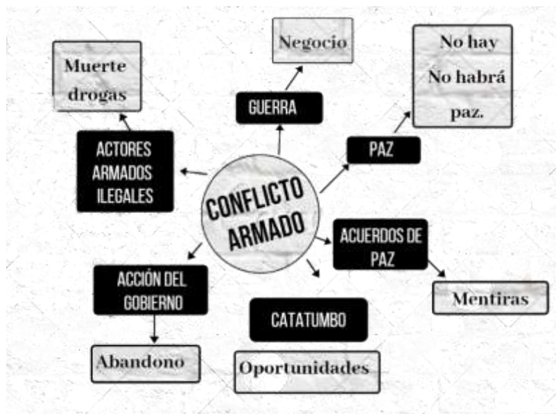
Figura 2. Resultados RS conflicto armado colombiano. Autoría propia.