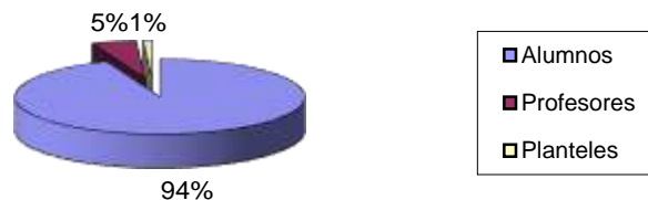
GRÁFICO 1.3 PLANTELES, PROFESORES Y ALUMNOS DEL PAIS SEGÚN EL NIVEL DE EDUCACION