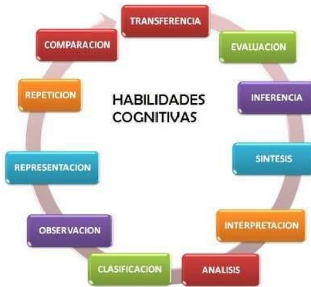
Ilustración 4: Habilidades Cognitivas