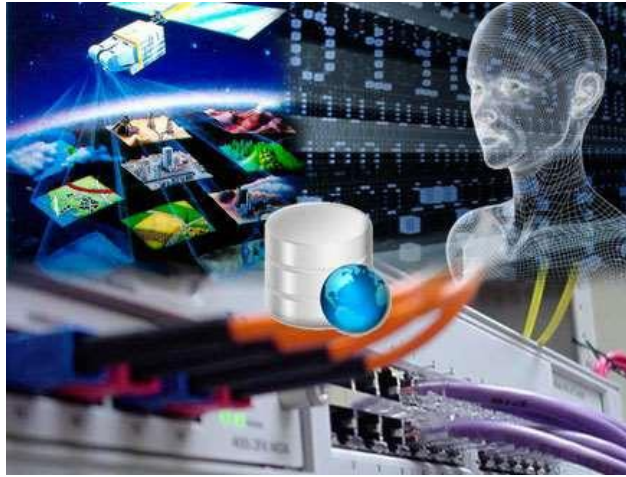
Ilustración 5: Importancia de la Abstracción