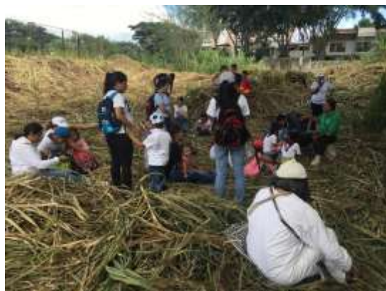
Foto No 16. (Barrio Valle del Lili).2018.