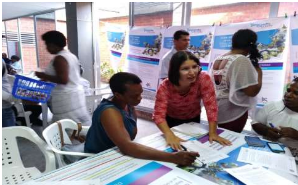
Foto 5. (Buenaventura- Valle del Cauca). 2016.