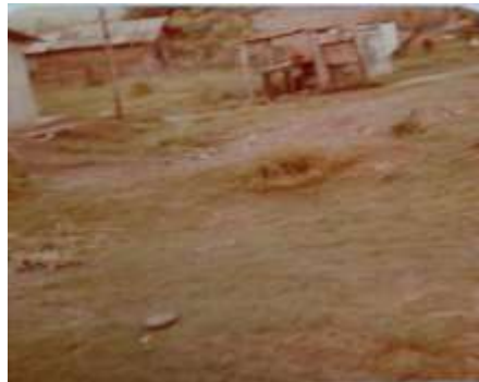
Foto No 2. (Barrio Valle del Lili).1970.