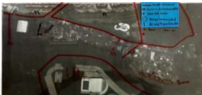
Foto No 14. Fotografía de José David Muñoz (Universidad Libre).2018. Archivo Grupo de investigación Pedagogía Nómada. Universidad Libre Cali

En el mapa de conflictos se puede evidenciar las necesidades insatisfechas presentes en el territorio, tales como el agua residual que es vertida directamente al río sin contar con un sistema de alcantarillado, inconvenientes referentes a riesgo de árboles por caída,