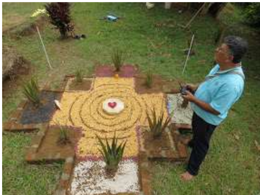
Foto No 9. Tomada por Antonio Gamboa (Chakana-SPA Natural).2018.Archivo fotográfico Pedagogía Nómada. Universidad Libre Cali

Un valor en la cultura de los pueblos ancestrales es lo comunitario y las interrelaciones entre los miembros de la comunidad. Aprender a ensamblarse en redes de interacción, logra transformar la vida personal, grupal, social, comunitaria y política, transitando de seres aislados “ neutrales ” a sujetos participantes y constructores del proceso cognitivo.