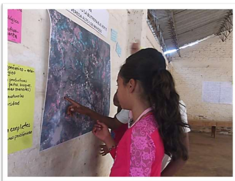
Imagen 2. Niños y niñas de la Vereda Alto los Mangos identificando en el mapa sus lugares de residencia

situaciones internas de la Vereda Alto los Mangos, tales como: la seguridad y convivencia, Juntas de Acción Comunal, servicios públicos, educación, salud, programa, proyectos públicos o privados; entre ellos, líderes y manejo de presupuestos. Después de realizar el diagnóstico - tanto interno como externo- se encontraron los factores claves de éxito. En el siguiente recuadro, están todas las variables encontradas, como: debilidades, oportunidades, fortalezas y amenazas. Se seleccionaron, de acuerdo con el grado e impacto que tienen sobre la región y, por ende, en el territorio seleccionado.