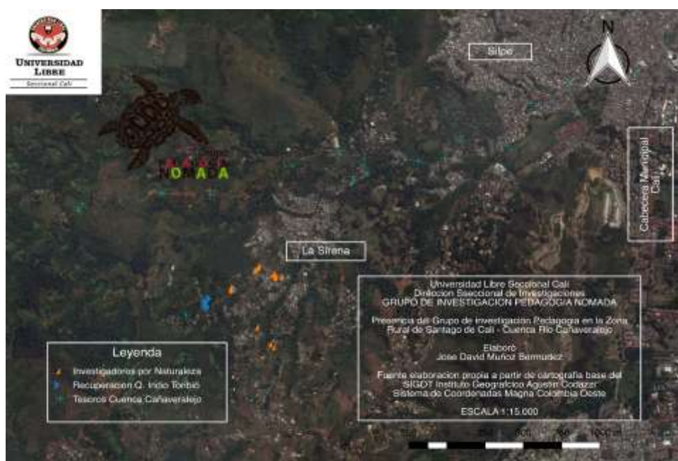
Ilustración 1: Mapa presencia Grupo de Investigación Pedagogía Nómada Zona Rural Municipio de Santiago de Cali