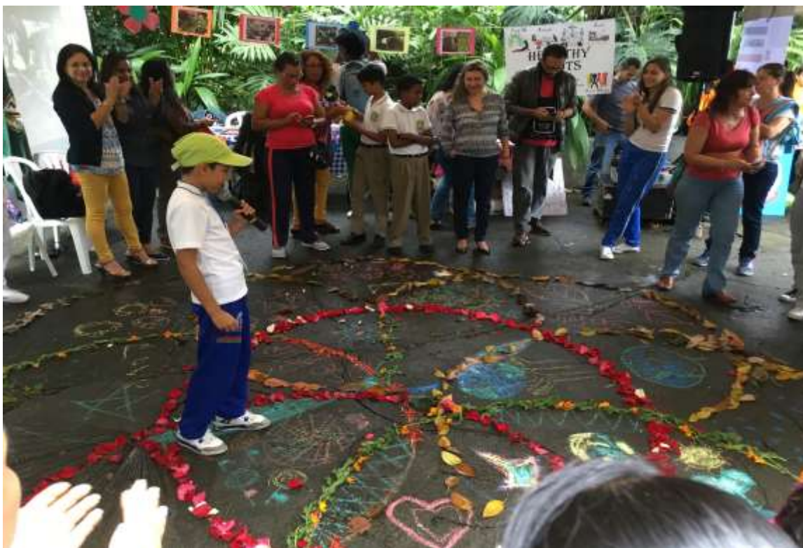
Foto No 7. Socialización de experiencias significativas PRAE- ESTILOS DE VIDA SALUDABLES. Elaboración colectiva de manda con flores y semillas. Alegoría a la vida y el cuidado del planeta.

de fichas de obra sobre la política de educación ambiental, políticas públicas de estilos de vida saludables y permitió mediante un proceso de sistematización hacer visible los avances y limitaciones que en este campo tienen las Instituciones Educativas Oficiales, proponiendo la recuperación de prácticas y saberes relacionadas con la cultura y conciencia ambiental, el consumo inteligente y el cuidado de sí como primer territorio de sanación.