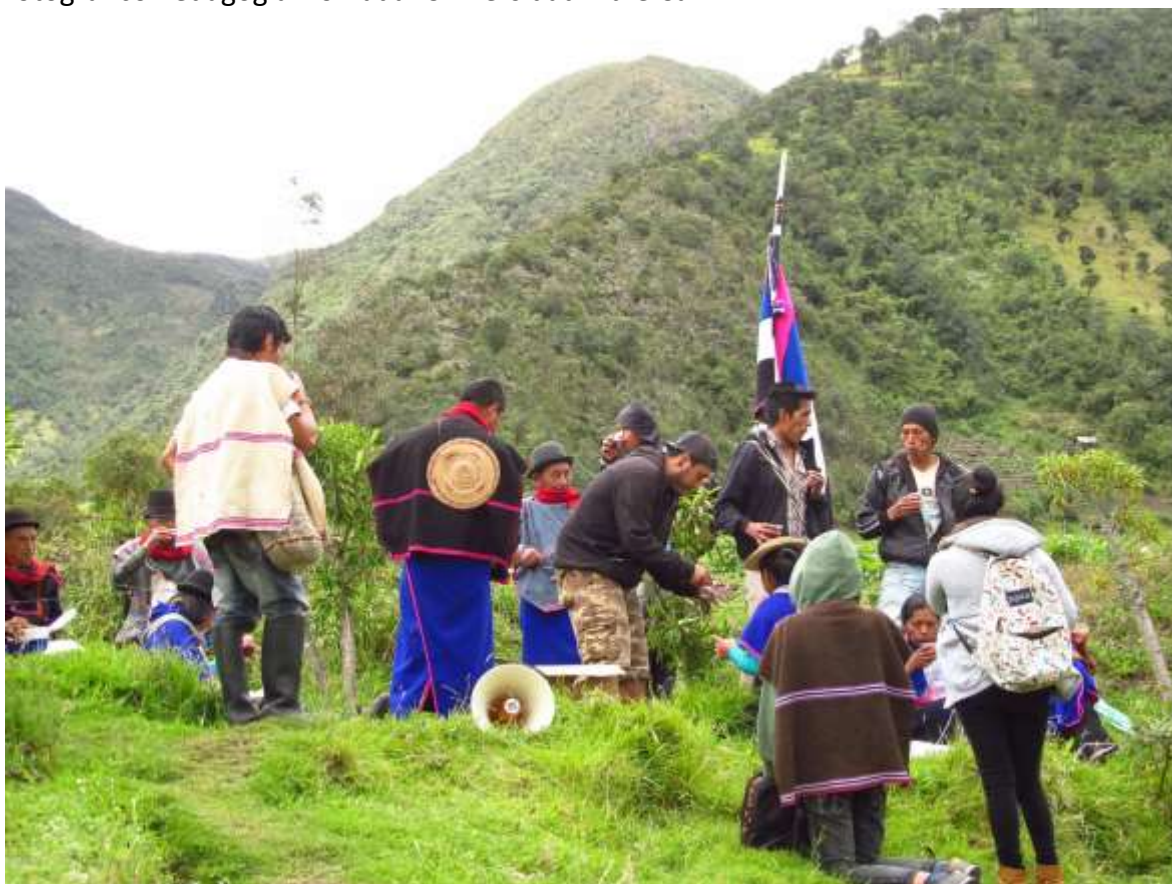
Foto 2. (Guambia-Cauca). 2016

En los devenires pragmáticos de la investigación creativa en las comunidades se aprende a reconocer al otro en la presentificación de su distinción específica, descubriendo en él la potencia ontológica del acierto ético, una convivencia sustentada en la confianza del acuerdo, así la concertación relacional se configura en la integración de la