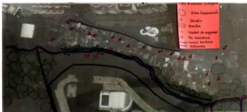
Foto No 13.

En el mapa se puede evidenciar el modo de producción del territorio en términos monetarios y de subsistencia, además el factor ambiental representado en afluentes principales y secundarios, zonas boscosas o de conservación presentes en el territorio e iniciativas productivas como huertas e iniciativas de embellecimiento de zonas verdes representadas en la construcción y diseño de jardines urbanos en espacios determinados.