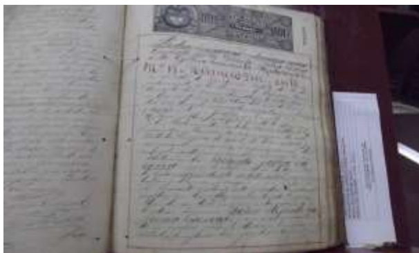
Foto No 7. Fotografía de Aymer Vásquez (Archivo histórico de Cali).2018. Archivo Grupo de investigación Pedagogía Nómada. Universidad Libre Cali.

Foto No 6. Fotografía de Aymer Vásquez (Archivo histórico de Cali).2018 archivo Grupo de investigación Pedagogía Nómada. Universidad Libre Cali.