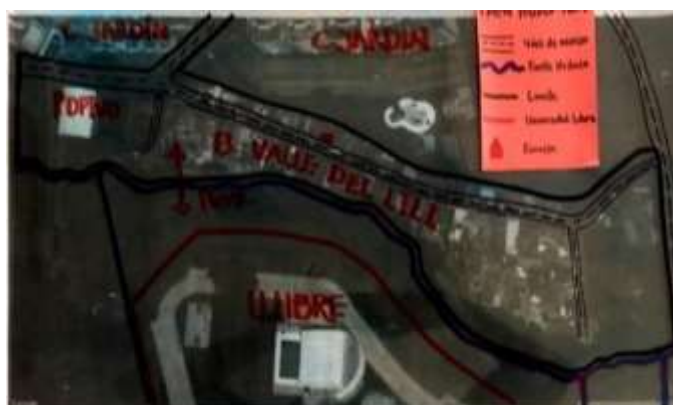
Foto No 11. Fotografía de José David Muñoz (Universidad Libre).2018. Archivo Grupo de investigación Pedagogía Nómada. Universidad Libre Cali

En el mapa se puede evidenciar la presencia del estado en el territorio por medio de una escuela pública y los límites territoriales los cuales son; el barrio ciudad jardín y los muros que limitan el territorio a el norte y el sur del mismo.