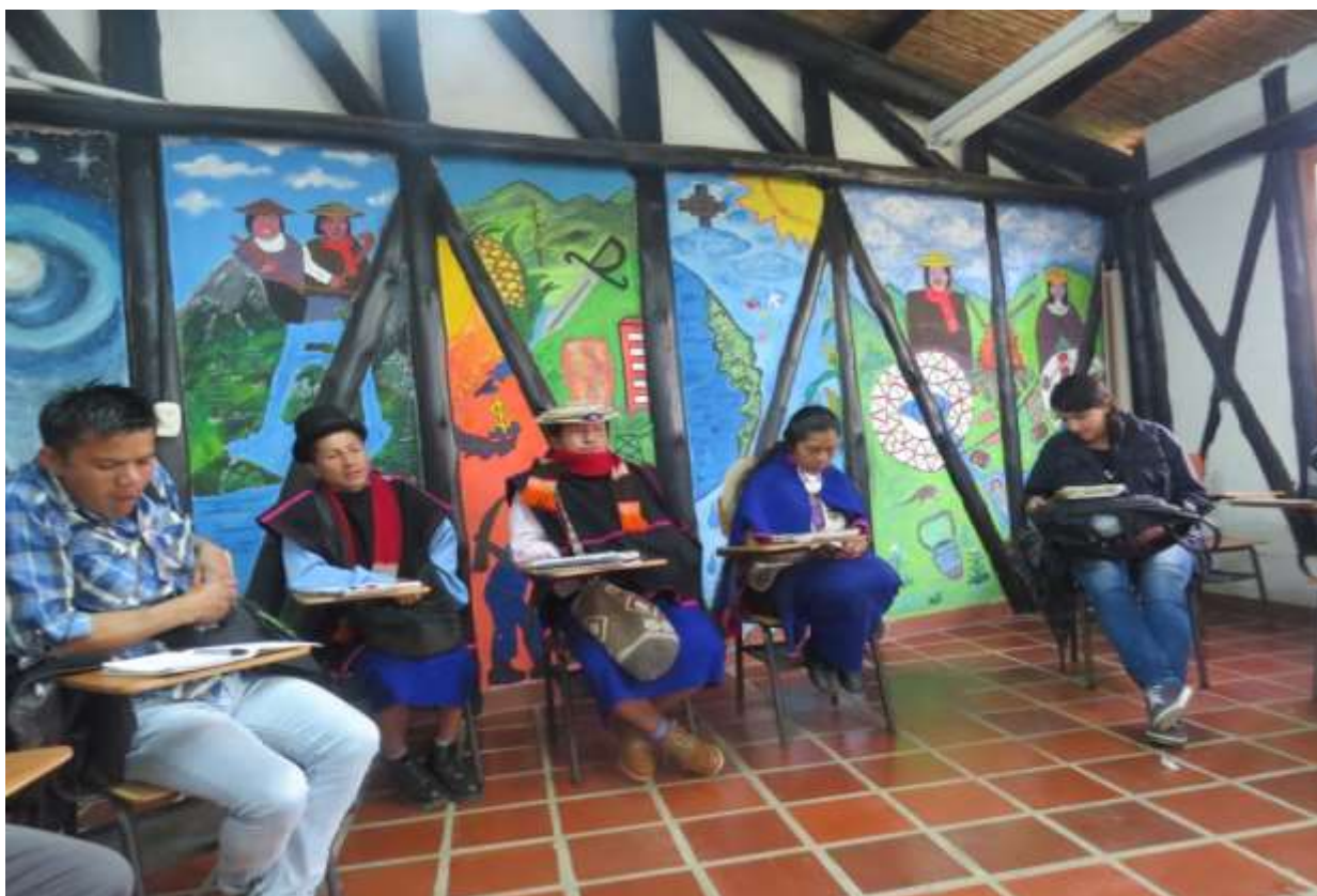
Foto 3. Tomada por Martín Camilo Jiménez Figueroa. (Misak Universidad, Guambia-Cauca). 2017 Archivo fotográfico Pedagogía Nómada. Universidad Libre Cali

El diplomado de investigación creativa ensambla y activa este acuerdo en la doble espiral que se expresa entre la realidad natural y la realidad artificial, es decir un pensar-hacer que se niega a continuar depredando