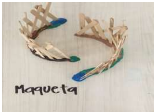
Foto No 10. Fotografía de José David Muñoz (Universidad Libre).2018. Archivo Grupo de investigación Pedagogía Nómada. Universidad Libre Cali

Foto No 9. Fotografía de José David Muñoz (Universidad Libre).2018. Archivo Grupo de investigación Pedagogía Nómada. Universidad Libre Cali