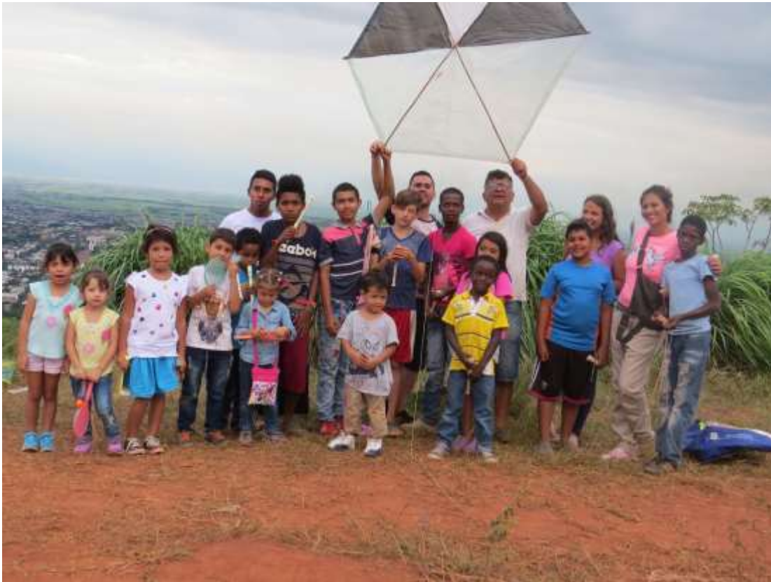
Foto No 8. (Alto de la Reforma, Cali).2016.

En la sistematización textual que se hace desde el diplomado del programa de investigación de la Manera Cultural, se producen varios “ productos SCIENTY ” como los artículos publicados en revistas indexadas: