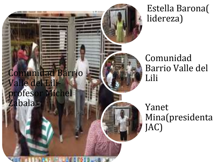
Figura 2.