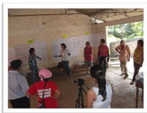
Imagen 3. Participantes lluvia de ideas

En la dimensión de Sostenibilidad Ambiental, se tuvieron en cuenta las siguientes variables: actividades productivas, manejo de residuos orgánicos e inorgánicos, contaminación de fuentes hídricas, programas de educación ambiental, conservación y explotación de los recursos naturales, deterioro del medio ambiente. Durante el ejercicio, los habitantes expresaron las situaciones problemáticas, según su percepción en el presente.