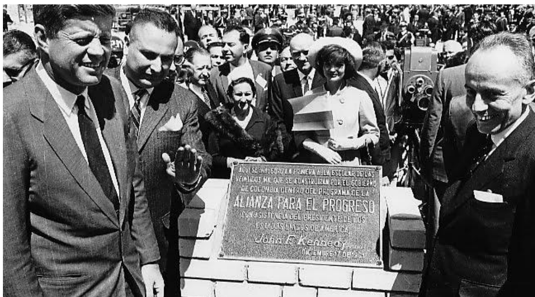
El presidente de Estados Unidos John Fitzgerald Kennedy y el presidente de Colombia Alberto Lleras Camargo en Colombia, 1961. En la placa se exalta la Alianza para el Progreso.