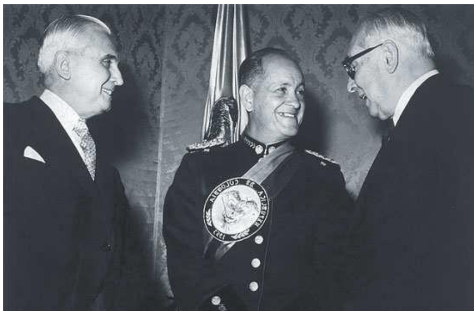
posesión presidencial General Gustavo Rojas Pinilla.

elecciones, el poder se repartiría en partes iguales entre los dos partidos, alternando la presidencia cada cuatro años. Además, todos los cuerpos legislativos se dividirían en partes iguales entre liberales y conservadores, toda la legislación del Congreso requeriría una mayoría de dos tercios para que tuviera efecto, un mínimo del 10 por ciento del presupuesto nacional se asignaría a la educación y las mujeres podrían disfrutar de la igualdad de los derechos políticos.