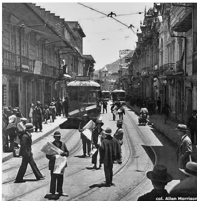
Tranvía. Carrera 7 de Bogotá en 1946

Los debates sobre la industrialización en Colombia han sido permanentes, así se ve reflejado en diferentes trabajos historiográficos que buscan de alguna manera, mostrar la realidad del país en este asunto. La economía, como la industrialización siempre han ido de la mano, como se mostró en líneas anteriores. El inconformismo de las dinámicas que presentan estos conceptos en Colombia, hace parte de ese entramado de voces que llaman la atención al proceso fallido de llevar al país a un desarrollo promisorio.