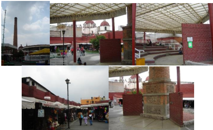
Figs. 1-5. Interior de Plaza de la cultura. Foro y detalle de corredor comercial