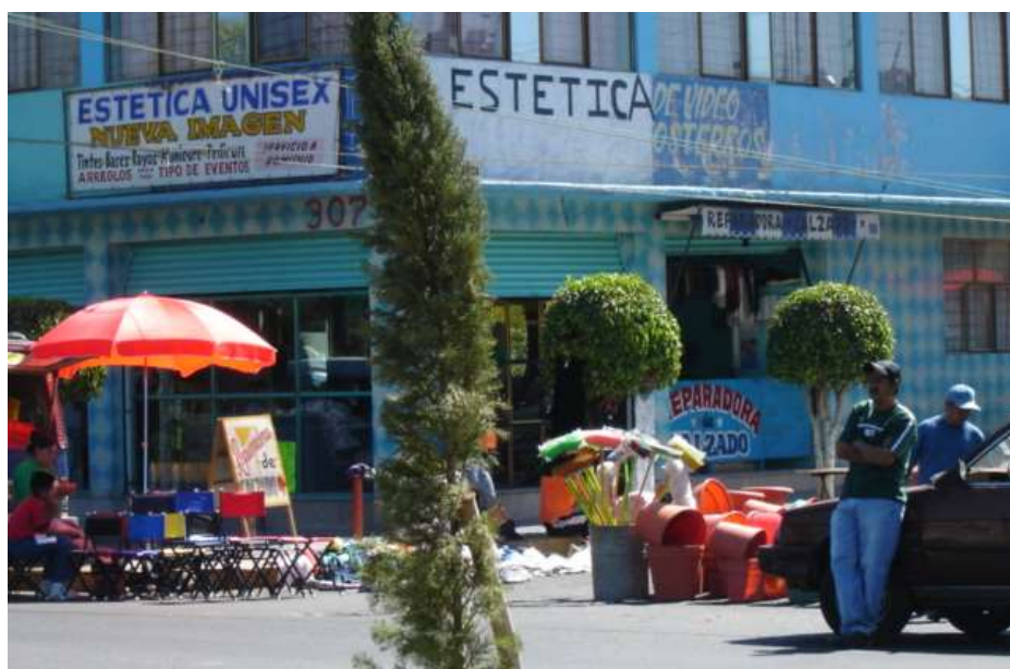
Fig. 13 Tianguis de los miércoles en la colonia las Fuentes, Neza

De hecho, este Instituto ha dejado que las empresas constructoras se encarguen de la edificación de conjuntos habitacionales, en donde los criterios de calidad son insuficientes. Y donde los costos son mayores, debido a la falta de exigencia de calidad del INFONAVIT y de la carencia de una vigilancia estricta de parte de los sectores demandantes de créditos de vivienda, como son los asalariados.