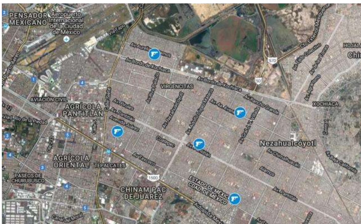
Fig. 14 Mapa Neza Google 221