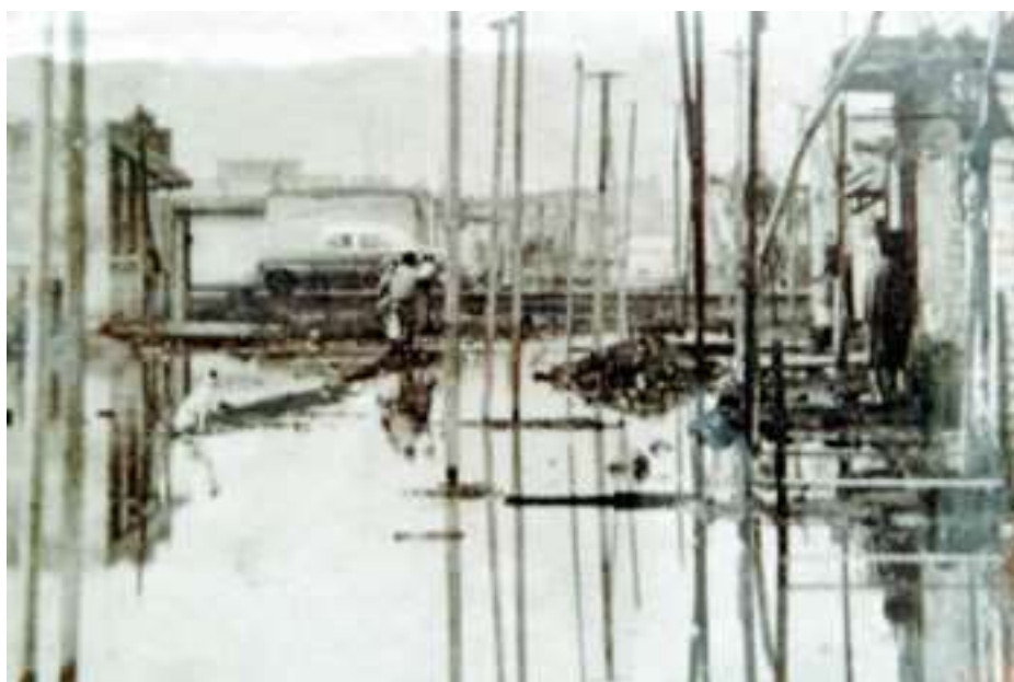
Fig. 12 Las lluvias inundando la ciudad en sus inicios. 165

Encontramos relaciones asimétricas entre el sector informal de la economía; los trabajadores del comercio ambulante y los de la economía industrial, no sólo desde el punto de vista salarial sino de oportunidades de empleo, productividad y seguridad en la obtención de ingresos y por lo tanto de garantía de mantenimiento de un nivel de vida mínimamente decoroso. La incertidumbre que arrastra el sector informal se refleja en el nivel de hábitat, ya que este no ofrece una garantía constante de recursos que posibiliten mantener el costo de una vivienda, es decir, los gastos constantes que implica la obtención y el equipamiento de esta.