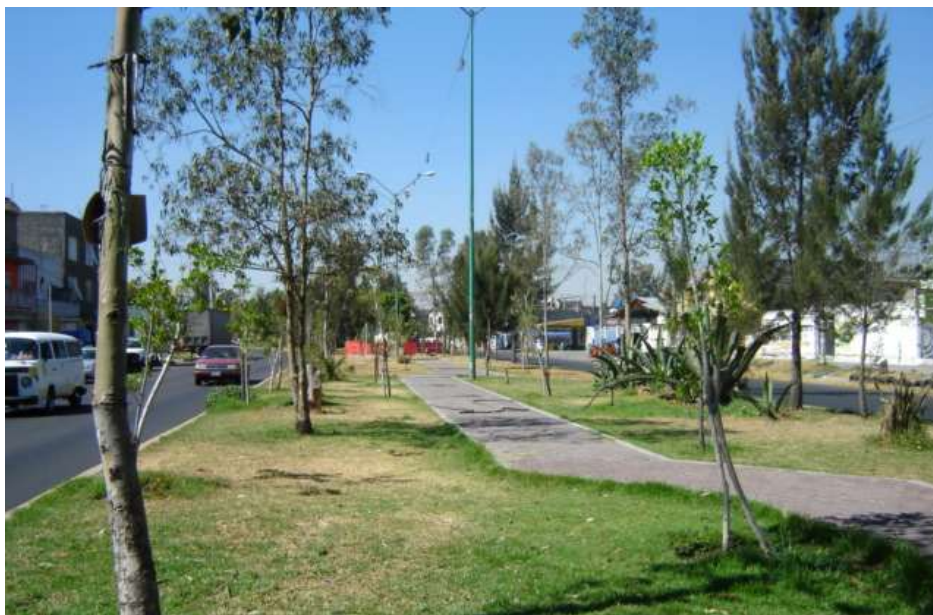
Fig. 4. Camellón en Avenida Neza. Visto de Sur a Norte