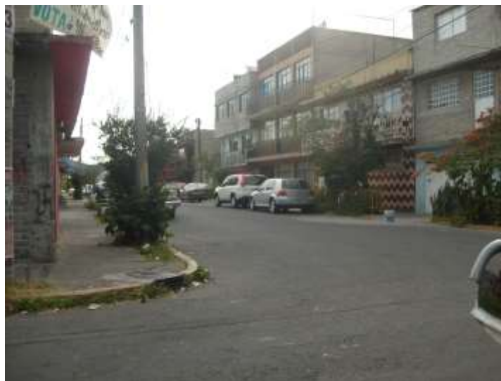
Fig. 11. Panorámica de edificaciones. Calle en Neza

El Estado ha sabido contener los movimientos sociales,” la provisión de bienestar social, representa un medio importante de aliviar la presión. Aunque para los pobres el resultado frecuentemente ha sido positivo, casi no hay duda de que la primera función del bienestar social ha sido de control social y aplacamiento” 146 . Sin embargo, es momento de profundizar las políticas de bienestar social. En los años ochenta la ciudad está en mejor situación que la provincia. Por ejemplo, en la enorme inversión que se dio en obra pública en los años de 1979, 1980 y 1982, en la ciudad de México; con la prioridad de terminar la construcción del metro, grandes inversiones se destinan a este rubro. Limitándose el apoyo a los Estados, atendiendo a la población citadina, demandante de mayor atención y con mayor grado de politización. De manera que a la planeación urbana se le ha usado para la justificación de decisiones políticas.