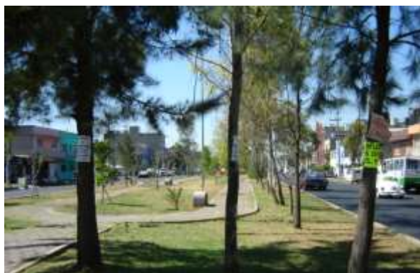
Foto 2. Camellón en Avenida Neza. Al centro de la ciudad