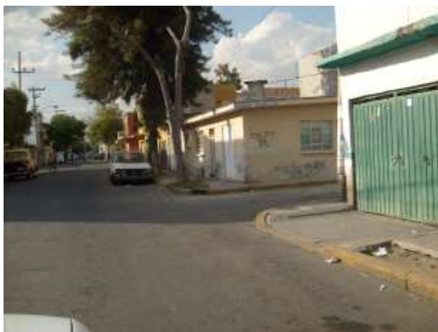
Fig. 18 Colonia las Fuentes, Neza

Ciertamente que los movimientos sociales urbanos poseen características inmediatistas fundamentalmente, pero es posible que a través de ellos se constituya la democracia desde abajo, esto implica una labor inmensa e intensa de parte de los elementos más conscientes de las organizaciones urbanas para garantizar la permanencia de un buen nivel político, del que aún están adoleciendo los dirigentes.