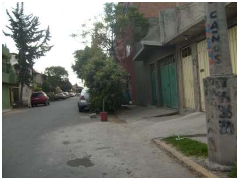
Fig. 9 Aspecto de una calle en la colonia Agua Azul