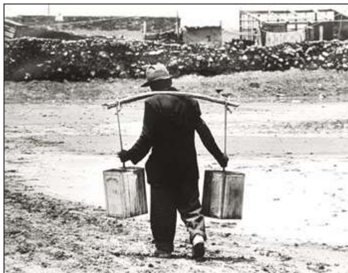
Fig 2. Acarreo de agua. Inicios de Neza. Años 40s 2

Cierto que ha habido interés reciente por estudiar lo que acontece en este municipio. Sin embargo, mucha de la información está aún dispersa. Los archivos y documentos que hablan de ciudad Nezahualcóyotl están aún por consolidarse. Los diversos estudios que hay acerca de la ciudad carecen de rigor histórico y metodológico. Los testimonios de los habitantes participantes en los movimientos sociales reivindicativos están por escribirse y es necesario profundizar en la investigación acerca de las experiencias de identidad urbana, organización y gestión de los colonos y generar la discusión de las diferencias y de las interpretaciones teóricas del fenómeno de los asentamientos humanos y sus expresiones; concretamente en esta joven ciudad.