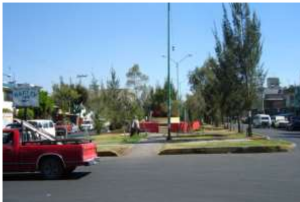
Fig. 8 Camellón Av. Neza de sur a norte