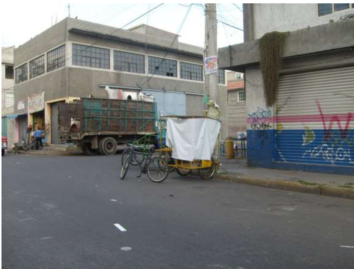
Fig. 1. Laguna San Cristóbal Esquina, Colonia Pirules Agua Azul. Nezahualcóyotl