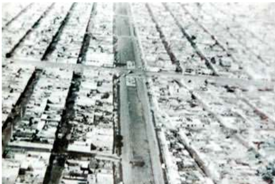
Fig. 6 Panorámica de Nezahualcóyotl. Homogeneidad constructiva 47

horas libres), circular" 45 , ya que solo se le ha dado interés a esta última, deficientemente. Así que el Urbanismo "transformará la imagen de las ciudades, romperá la aplastante coerción de unos usos que han perdido su razón de ser y abrirá a los creadores un campo de acción inagotable". 46 La vivienda es considerada como la prioridad del urbanismo. Así como el principio de circulación urbana.