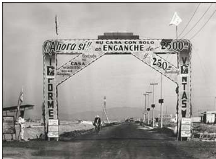
Fig. 5. Promoción venta de lotes en Inicios de Nezahualcóyotl. 38

En la interpretación del proceso constitutivo de la ciudad se expresan diversas tendencias, en las cuales está implícito el discurso del poder de los sectores dominante y las alternativas de los sectores subalternos de la ciudad, que muchas veces se nutren de la propuesta del estudio de la ciudad desde la perspectiva del materialismo histórico que considera una visión objetiva de la realidad de la ciudad y de sus habitantes.