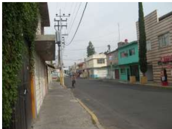
Fig. 15 Fuente de petróleo, Colonia Modelo, Neza