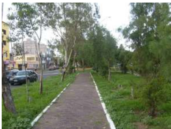
Fig. 17 Camellón en Av. Neza. Un fragmento verde de la ciudad

Es importante la difusión de la Agricultura Urbana en la población. La Agricultura Urbana está integrada necesariamente al ordenamiento territorial, y a la misma planificación del ordenamiento ecológico. El cual recurrentemente se está legislando, ya que es un tema de gran relevancia social.