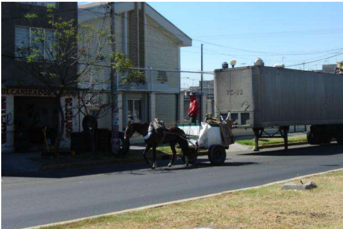
Fig. 16 Avenida Nezahualcóyotl, Colonia Agua Azul, Neza