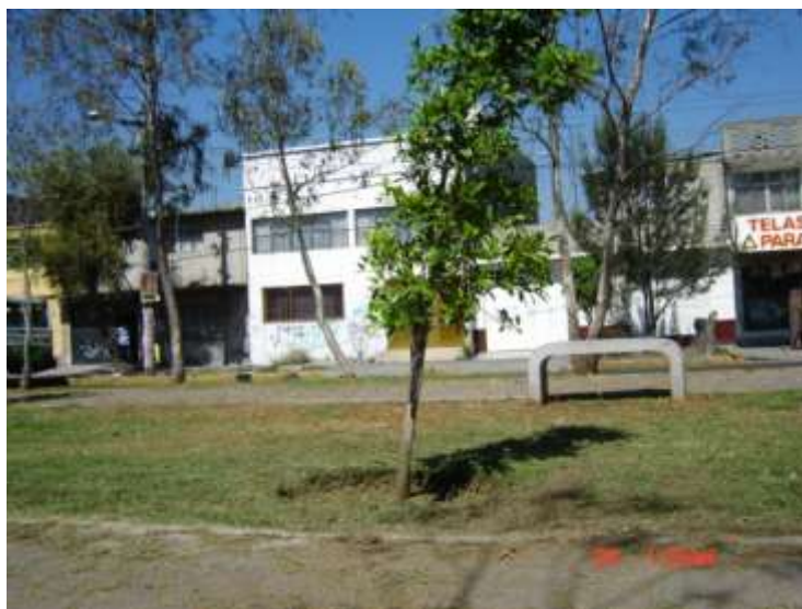
Fig. 7 Camellón Av. Neza.

que orientan su participación a la organización desde abajo para la transformación de la estructura político-económica. En 'La ciudad y la pradera' , Castells plantea la importancia de la autogestión y de la movilización ciudadana en los llamados movimientos sociales urbanos, asimismo debemos de valorizar la enorme importancia de las nuevas corrientes de interpretación de lo urbano y de tendencias contemporáneas. Castells habla de las condiciones de dificultad que presentarán en pocos años las ciudades, desde el enorme caos en el transporte hasta la lógica de que la ciudad no perderá su importancia como centro de gravedad; las ciudades son centros de negocios y de producción de valor basados en la información, así como espacios de realización y de poder real y simbólico. 58