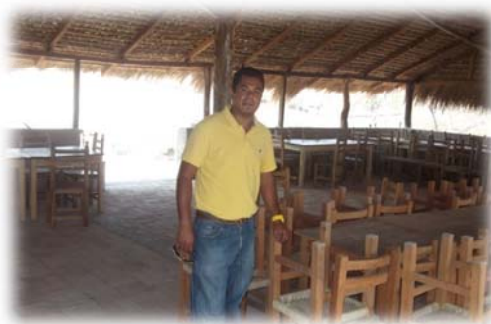
Imagen no.20 (Comedor)