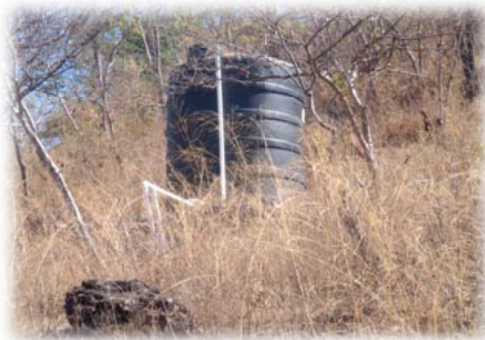
Imagen no. 24 (Cisterna y tubería de PVC)