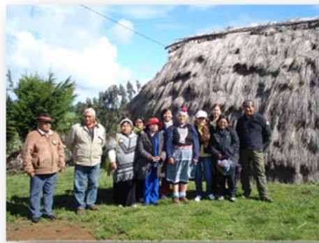
Imagen no. 2 (Música y danza mapuche) imagen no. 3 (familia tradicional mapuche)