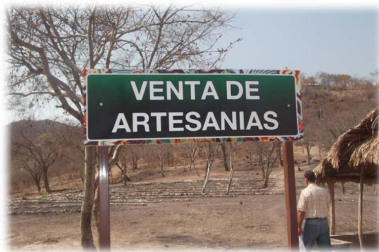
Imagen no. 21 (Expianada para venta de artesanías)

Así pues posicionándonos en la realidad del entorno y recursos disponibles, el mercado artesanal no será otra cosa más que un tejaban hecho con puntales de madera que se encuentra en la región y techado con hojas de palma y paja con las que tradicionalmente se protegen las viviendas de la región. Ahí se le asignará un espacio a cada familia donde pueda exhibir y transar sus artesanías. Cabe mencionar que la ubicación será en un punto estratégico donde sin duda, tenga proyección y sea una parada ineludible de todos los turistas.