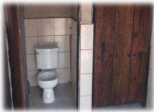
Imagen no. 10 (Baños públicos)

Es pertinente mencionar que todas las actividades anteriormente citadas tuvieron que reforzarse con el mobiliario urbano necesario como son las letrinas secas y baños públicos, equipo, sistema de distribución de agua, la reconstrucción de escuelas, un dispensario médico, el comisariado ejidal, entre otros aspectos de servicios básicos comunitarios ; ya que a raíz del derrumbe que sepulto la mitad del pueblo original y que éste se tuvo que trasladar colina abajo, los servicios anteriormente citados son una debilidad a subsanar en la comunidad.