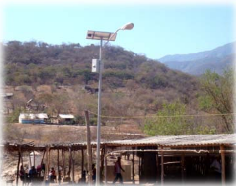
Imagen no. 12 (Alumbrado público)