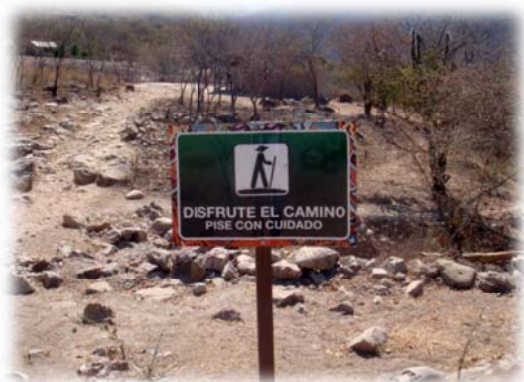
Imagen no. 14 (Instalación de señalamientos)

Lo anterior aparejado con la instalación de señalamientos adecuados, bebederos, bancas, letrinas, así como la capacitación de pobladores de la comunidad para que funjan de guías, mismos que deberán tener conocimiento de la zona, de primeros auxilios y en un esfuerzo mayor también incentivarlos a manejar una tercera lengua, ya que por origen tienen la endémica que es la Wixárika o Huichol, hablan el castellano y la tercera posiblemente pudiera ser el idioma Inglés.