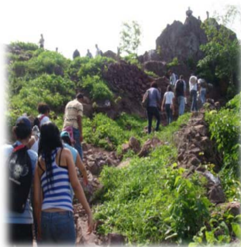
Imagen no.15(Recorridos por senderos)