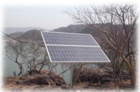
Imagen no. 23 (Celdas solares)

Así pues, para concluir el presente apartado, se debe mencionar que la nueva comunidad de Zapote de Picachos, al ser reubicada después del derrumbe que destruyó la mitad del pueblo original, el Gobierno del Estado instaló una red para agua con tubería de PVC, e instaló tinacos para contar con agua potable en toda la población. Así como también se instalaron fotoceldas para la captación de energía vía solar, las cuales alimentan una ligera pero útil red de alumbrado público.