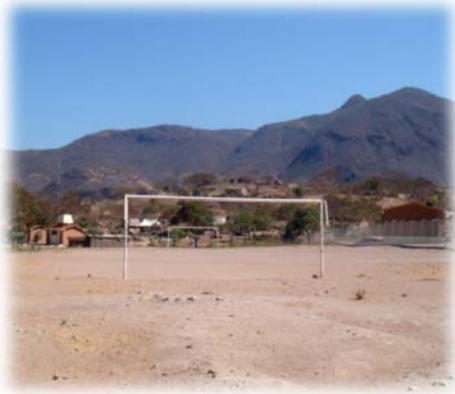
Imagen no. 25 (Campo deportivo)