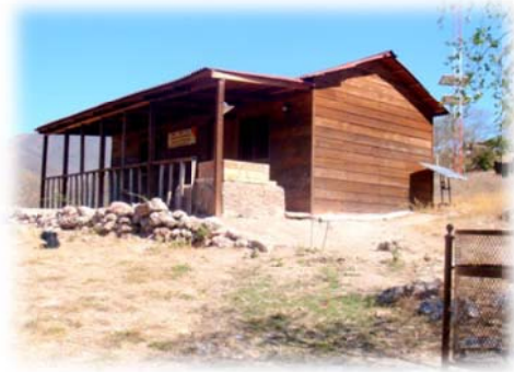
Imagen no. 17 (Museo vista externa)