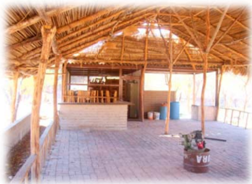
Imagen no. 19 (Cocina y comedor)

La infraestructura tiene unas dimensiones generales de 10 metros de ancho por 15 metros de largo, con capacidad para 13 mesas con cuatro sillas cada una, dando un total de 52 comensales como máximo en ésta primera etapa. La Cocina se equipará con estufa de gas y una hornilla, lavaplatos y fregadero, alacenas para guardar los cubiertos y loza, estantes para almacenar especias y salsas, entre otros muebles y utensilios básicos, esto con la intención de que no se rompa el equilibrio con el entorno y se asemeje lo más posible a la cotidianidad en la que se desenvuelve la comunidad y no pierda el misticismo y lo ceremonioso que puede ser el momento de alimentarse de un Indígena.