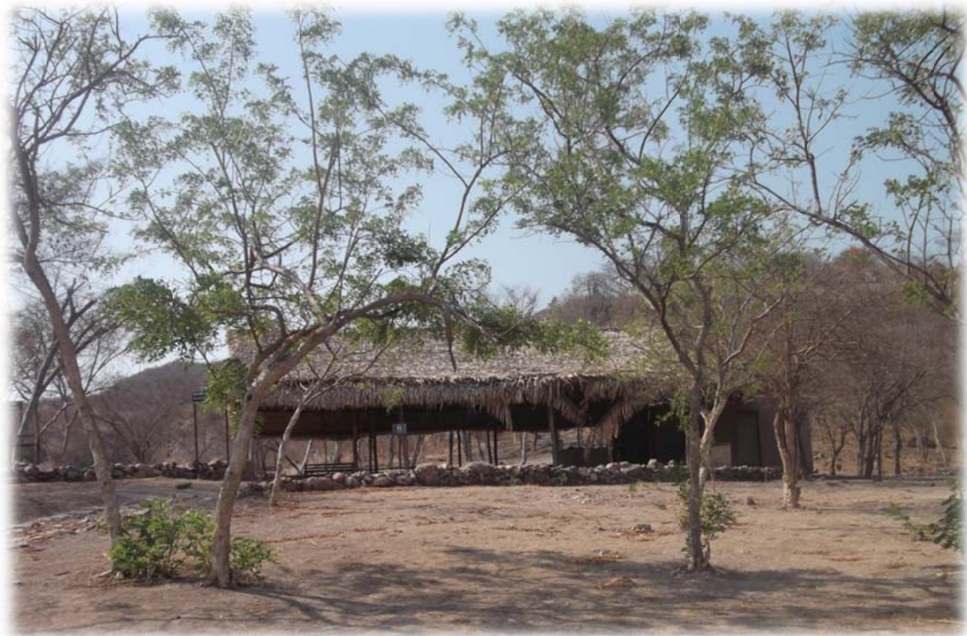
Imagen no. 27 (Zona para acampar)