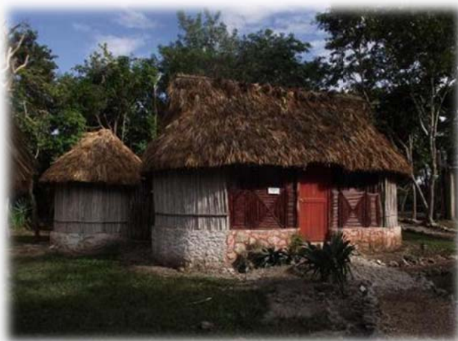
Imagen no. 6 (Cabañas ecológicas Uh Najil Ek Balam)