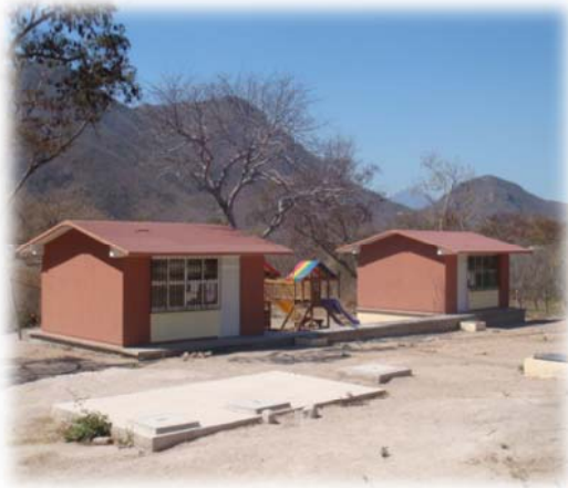
Imagen no. 26 (Jardín de niños)