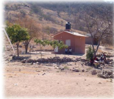
Imagen no. 11 (Dispensario médico)