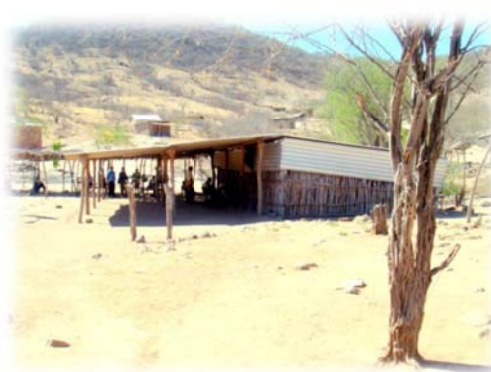
Imagen no. 13 (Comisariado ejidal)