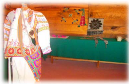
Imagen No.16 (Museo comunitario)

El turista, al salir o antes de entrar al museo comunitario, podrá conocer en el cosmos mural Wixárika o Huichol, donde se plasmará la filosofía de los cantadores de la tierra y del mundo vistos desde la influencia del gran peyote.