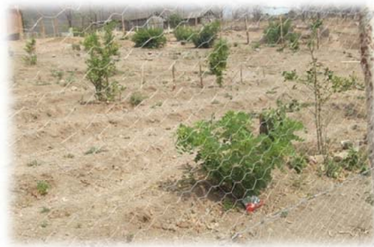
Imagen no. 22 (Jardín botánico)

Las necesidades para la implementación del jardín botánico son mínimas, ya que sólo se necesita de la limpieza de un predio de alrededor de media hectárea, la segmentación de áreas específicas para cada tipo de cultivo, una cisterna para almacenamiento de agua, y una bomba; mencionar que no se implementa un sistema moderno de riego, ya que este rompería con los modelos tradicionales de siembra, cultivo y cosecha de las comunidades indígenas e iría en contra del sentido del proyecto.