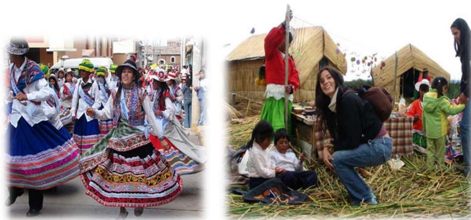
Imagen no. 4 (Desfile tradicional) Imagen no. 5 (Conservación de viviendas y tradiciones)

El complejo arqueológico de Sillustani, ubicado a 34 kilómetros de Puno. Es famoso por las chullpas que son torreones circulares de piedra, levantados para albergar los restos de las principales autoridades de los antiguos pobladores del Collao. A poca distancia del complejo se ubica el Museo de Sitio, en el que se conservan diversas piezas de las culturas Colla, Tihuanacota e Inca.