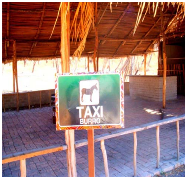
Imagen No.18 (Estación de taxi burros)

Para la reactivación de esta modalidad de transporte ya se cuenta con la remuda y los arrieros, se trabaja en los señalamientos, la ubicación de la terminal donde se abordan y los respectivos señalamientos. Cabe mencionar que la contaminación causada por heces de burro es responsabilidad del propietario, ya que cuando no esté en servicio deberá encargarse de la recolección, así como del aseo y alimentación de su animal.