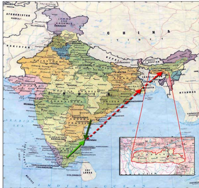
Imagen no. 1 (Ubicación geográfica de Meghalaya)

El pequeño estado de Meghalaya ("Encima de las nubes") tiene como capital a la ciudad llamada Shillong.