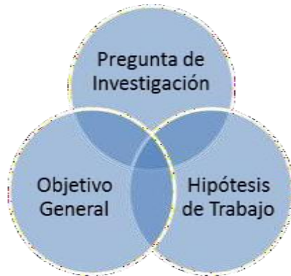
Figura 1. Los Elementos Triuno de la Investigación

contexto de estudio, en donde la formulación de la pregunta de investigación debe averiguar el ¿cómo?; mientras que el objetivo general describe el ¿qué?, el para qué? y finalmente el ¿a través de qué?, para que la hipótesis del trabajo establezca una suposición positiva u optimista sobre el planteamiento establecido.