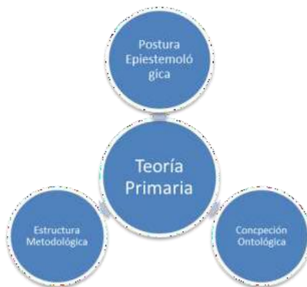
Figura 2. Atributos de manifestación de una Teoría Primaria

Habiendo trabajado previamente en la problematización del fenómeno bajo estudio, el investigador ha definido los siguientes aspectos: los antecedentes de la situación, la importancia o justificación del proyecto, los objetivos y las hipótesis, así como la pregunta de investigación, para que posteriormente continúe haciendo la revisión de literatura, misma que figurará en el capítulo del marco teórico, para lo cual se requiere que el investigador seleccione la teoría primaria, con lo cual estará definiendo el tipo de interpretación que desarrollará sobre el objeto de estudio, así también estará manifestando su postura epistemológica, su concepción ontológica y la estructura metodológica que será empleada (Reyes, 2014).