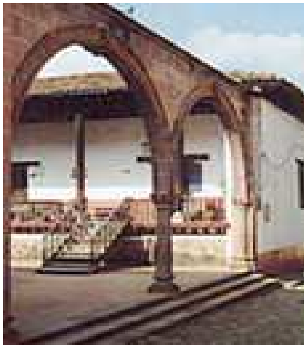
Casa de los Once Patios

E.- Plaza Vasco de Quiroga. Considerada una de las más bellas de América, localizada junto a la gran plaza, se encuentra rodeada de edificios de la época colonial. Su dimensión, las majestuosas casonas construidas a su alrededor y la ausencia de edificios religiosos, la hacen diferente de todas las demás.