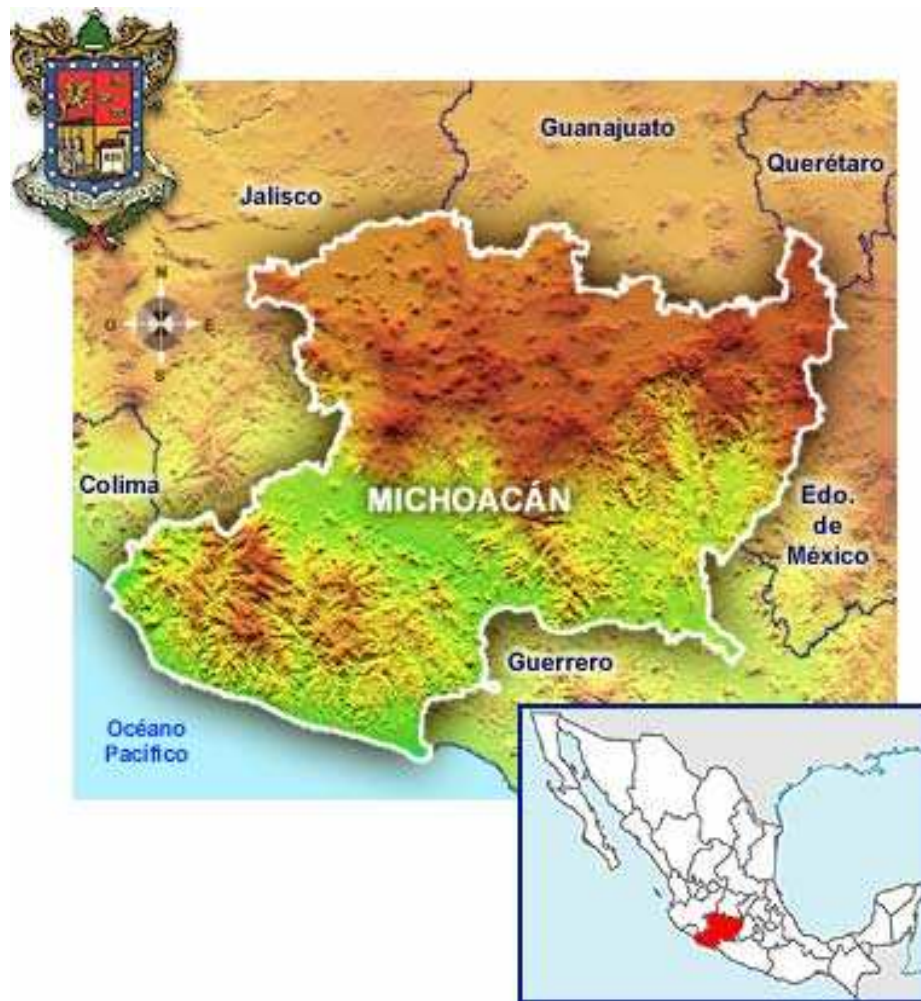
Ubicación del estado de Michoacán en México