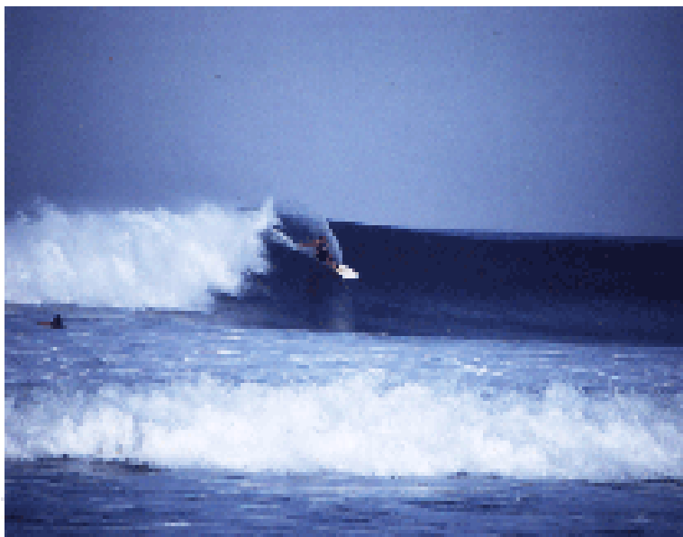
Las Olas del mar en la costa michoacana

Sin embargo, si el visitante no es aficionado al surf, tendrá a su disposición una variedad de increíbles paisajes en la costa michoacana, que a lo largo de 213 kilómetros ofrece las más variadas vistas, con acantilados, esteros, bahías, caletas, formaciones rocosas y arenas que van desde los tonos negros hasta los dorados más claros. Por ejemplo, el Río Balsas, por su facilidad de navegación, es un importante atractivo turístico, que durante varios años fue el escenario de un Maratón Náutico Internacional. 207