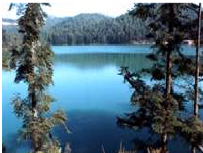
Laguna Larga en Los Azufres