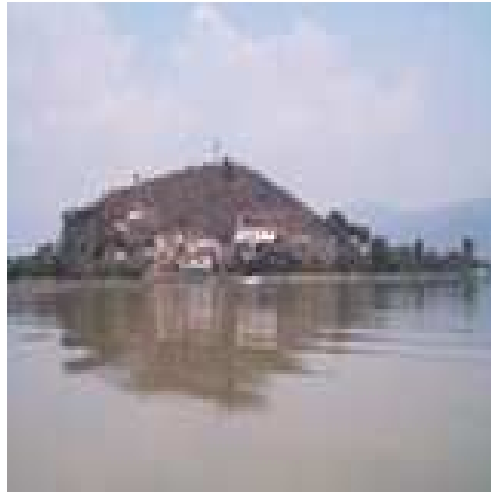
Isla de Tecuena

13.- Isla de Tecuena: Esta a 25 minutos del muelle, al norte de la isla de Janitzio. Es un sugestivo lugar que invita al descanso y reflexión. Desde su mirador se puede contemplar una hermosa vista del lago.