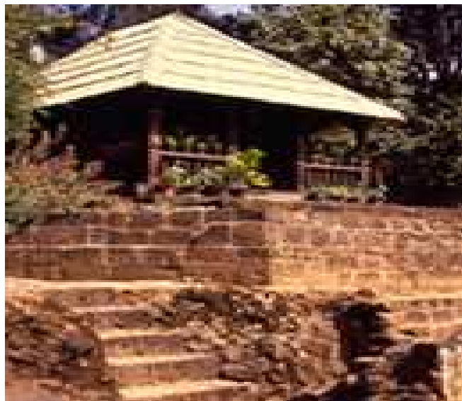
Museo de Artes e Industrias Populares

C.- Templo y Colegio de la Compañía de Jesús. Su construcción data del siglo XVII, es un edificio con un hermoso patio y espacios amplios que proporcionan una sensación de tranquilidad. Actualmente este edificio es la Casa de la Cultura.