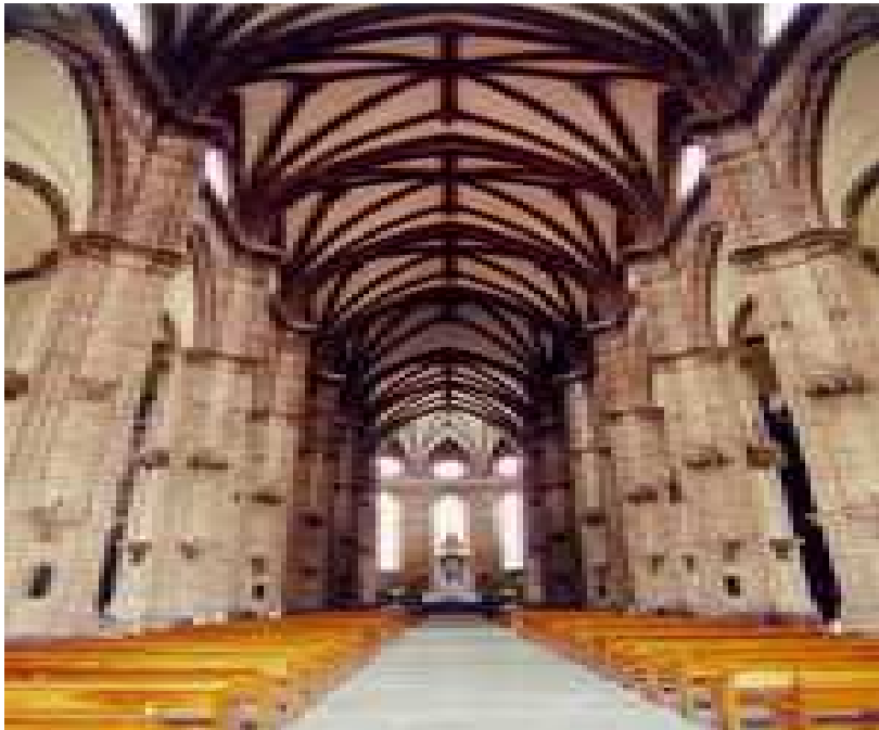
Catedral de Zamora

Enríquez. La obra fue diseñada y dirigida por el maestro arquitecto Nicolás Luna. Es notable su fachada, la nave principal es muy alta, con bastante iluminación que permite apreciar el decorado interior. 192