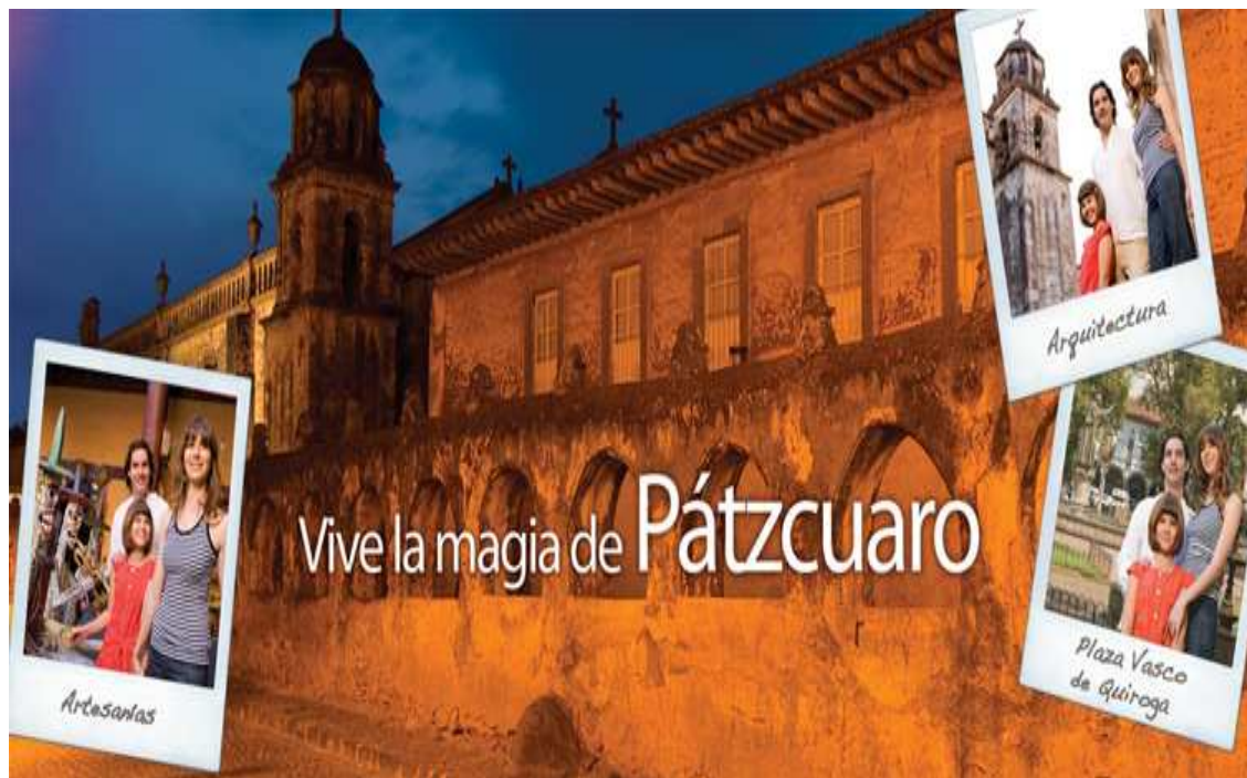
Poster turístico promocional de Pátzcuaro