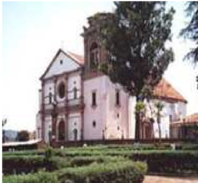
Basílica de Nuestra Señora de la Salud

B.- Museo de Artes e Industrias populares. En el siglo XVI fue sede del Colegio de San Nicolás, fundado por Don Vasco de Quiroga, con el objeto de preparar a jóvenes españoles que se quisieran ordenar como sacerdotes, así como enseñar a los indios a leer y escribir y a desempeñar algún oficio. Este museo es el primero en su género dentro de la República Mexicana. Cuenta con las mejores colecciones de lacas, maque y perivanas. El increíble piso de hueso de animal y piedra laja. 120