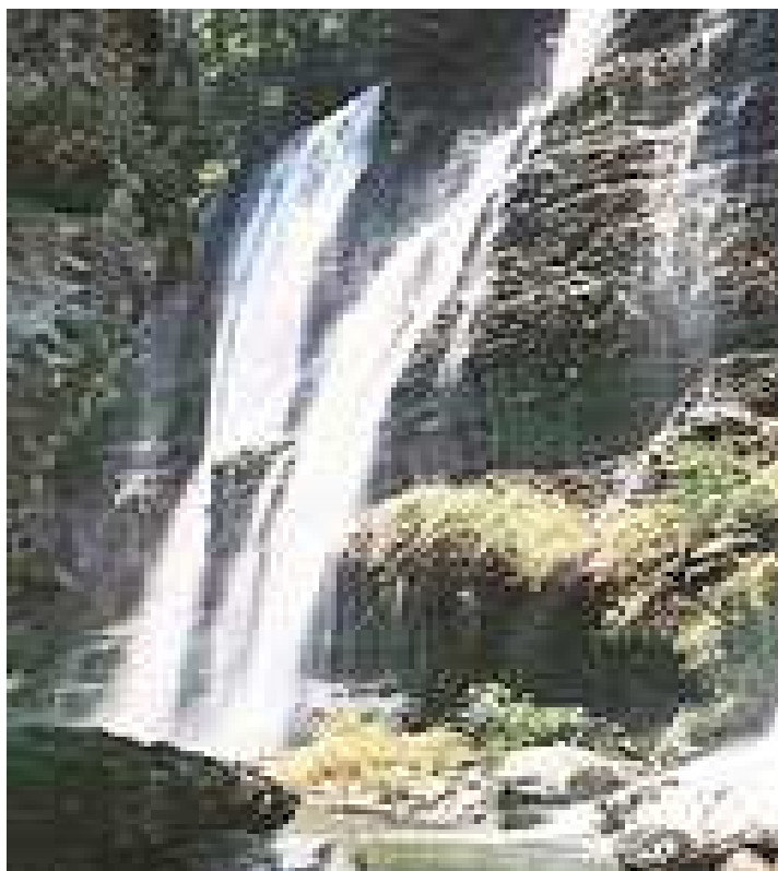
Chorros del Varal en Los Reyes