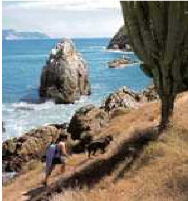
Costa de Michoacán

de baja velocidad y clasificadas en lenguaje técnico como "olas de un punto", es decir que salen en una sola dirección. 205