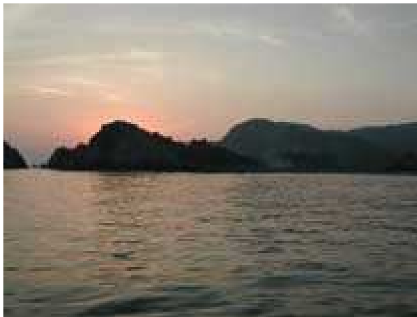
Belleza natural de la costa de Michoacán

Resulta también importante subrayar que las playas de Michoacán, son el refugio para el desove y reproducción de tres tipos de tortuga marina, Golfina, Laud o gigante y tortuga negra, que arriban de junio a octubre y que constituyen una importante reserva ecológica, la cual no deja de ser una maravilla de nuestro estado.