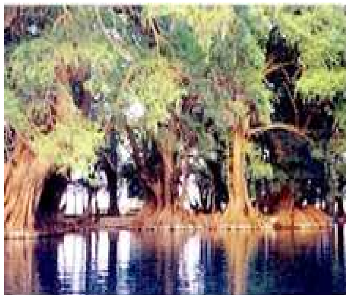
Lago de Camécuaro

C. La Cañada de los Once Pueblos. Es un pequeño valle que corre de este a oeste en el borde de la Meseta Purépecha. El municipio de Chilchota abarca la totalidad de las once poblaciones que forman parte de la cañada y son: Urén, Tanaquillo, Acachuén, Santo Tomás, Zopoco, Huáncito, Ichán, Tacuro, Carapan, San Juan Carapan y Chilchota. Aquí el visitante encontrará hermosos poblados típicos, artesanía, tradición y gran variedad de platillos. En Chilchota se elaboran azahares y XV de gran calidad. La cañada de los Once Pueblos y la Ciénaga de Zacapu, son herederos de fiestas, costumbres, música, danza, gastronomía y artesanías purépechas. 199