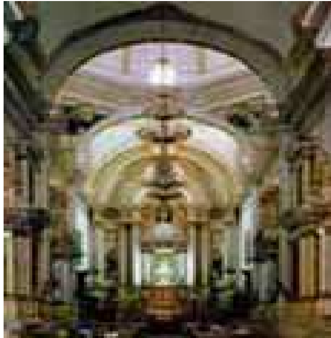
Exconvento de San Agustín

G.- Templo de San Francisco. Templo de tipo ecléctico. En su interior se conserva un cristo de pasta de caña de maíz elaborado en el siglo XVI y una pintura al óleo que representa las dos figuras más importantes para esa orden. La puerta de acceso al claustro es una de más bellas obras renacentistas que existen en la ciudad.