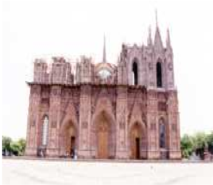
Santuario Guadalupeano en Zamora

8.- Parroquia del Señor de La Salud (Calvario). Un pequeño atrio circunda este templo de alto valor arquitectónico por la construcción asimétrica flanqueada por dos torres, ambas de dos cuerpos y remate piramidal. La fachada está rematada con balaustrada y reloj central. Es sede de las festividades de Semana Santa.