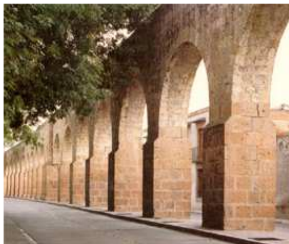
El acueducto de la ciudad de Morelia

El siglo XVIII es considerado como la edad de oro de Valladolid, para 1744 finalizaron las obras de construcción de La Catedral; el tradicional Acueducto se erige a finales del siglo XVIII con 253 arcos. 106