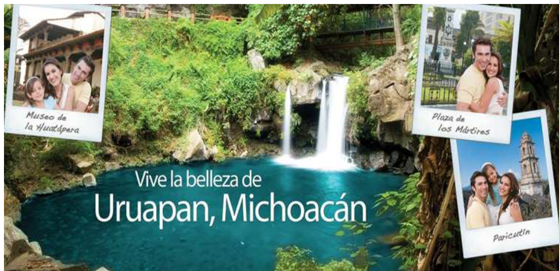
Poster turístico promocional de la ciudad de Uruapan

Festividades más importantes para esta región en verano son: