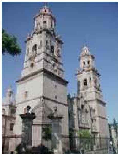
Catedral de Morelia

La ciudad de Morelia aparte de ser capital del estado, es un sitio ideal para visitar, su lugares más emblemáticos son: su centro histórico, sus monumentos coloniales tales como la Catedral, las Tarascas, el Acueducto, sus preciosas plazas públicas, el Colegio de San Nicolás de Hidalgo, más de 10 interesantes museos y un mercado de dulces y artesanías, donde el turista puede adquirir los tradicionales dulces michoacanos, como ates y las exquisitas morelianas, así como la artesanía típica de todo el estado de Michoacán. 107