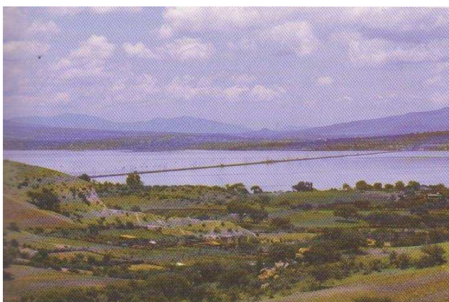
Lago de Cuitzeo

Se producen heladas en casi toda la entidad con excepción de la región Costa y la parte más baja de Tierra Caliente en la Cuenca del Balsas, en Tepalcatepec, cuya intensidad disminuye a medida que el clima se torna más cálido y no afectan las regiones cálidas. Las heladas se presentan entre 105 y 120 días al año en la altitudes superiores a 2 400 metros sobre el nivel del mar.