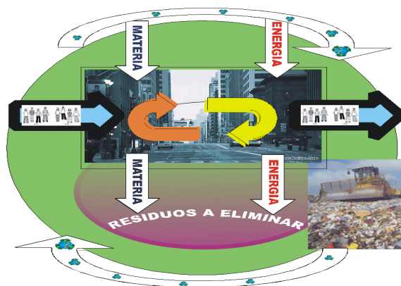
Figura 1.- Flujos de entrada y salida de energía dentro del área urbana.

En cuanto a los residuos sólidos en las ciudades, los que no son recogidos por la falta de una buena recolección, ocasionan que una cantidad significativa sean dispuestos en tiraderos clandestinos, lotes baldíos, barrancas y cauces de arroyos sin ningún control (SEMAR-NAP-INE, 2001). La limpieza de una ciudad depende de las acciones del ayuntamiento y la participación social, indicadora básica de la eficiencia en el manejo adecuado de los residuos sólidos urbanos.