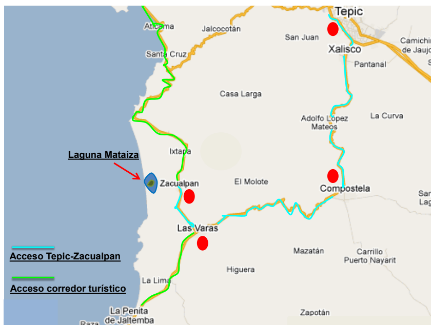
FIGURA 1. LOCALIZACION DE LA ZONA DE ESTUDIO