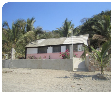
Salón del Reino de los Testigos de Jehová, en la localidad de San Francisco, Bahía de Banderas.

En relación con el estado de Nayarit, que presenta en el 2010, el 6.59% de la población adherido a iglesias protestantes evangélicas y bíblicas diferentes de evangélicas, Bahía de Banderas le supera en el porcentaje, con el 9.48%. Destaca que en el municipio de Bahía de Banderas, los Testigos de Jehová alcanzaron en el 2000, el 2.62%, mientras que para el 2010, incrementaron su porcentaje al 2.82%, lo cual tiene que ver con el conocimiento del territorio, el número de