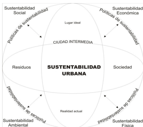
Figura 2.- Modelo de sustentabilidad urbana en las ciudades intermedias.

La Agenda 21 se ha ampliado para convertirse en un movimiento que está dirigido a abordar los problemas en las ciudades y la gestión urbana a través de una serie de enfoques y técnicas, como instrumentos económicos y sistemas de regulación, uso de la tierra, planificación estratégica urbana, planificación del transporte y la gestión, planificación y diseño del sitio de construcción, gestión de los residuos, evaluación del impacto ambiental, procedimientos estratégicos de impacto ambiental, procedimientos de auditoría ambiental, estudios de capacidad, estado de informes de medio ambiente, indicadores de desarrollo sostenible y consultas de planes (Figura 2).