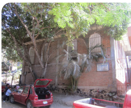
Templo de la Iglesia Interdenominacional en la localidad de Sayulita, Bahía de Banderas.

A la fecha, las organizaciones religiosas han establecido nueve Centros de Culto Religioso (Templos y Salones del Reino), en las localidades de Lo de Marcos, San Francisco y Sayulita, donde realizan labor de proselitismo mediante estrategias diversas (prédica casa por casa, campañas evangelísticas, congresos de sanación, retiros espirituales, proyección de películas y documentales, etc.) para lograr tener en sus congregaciones el mayor número de miembros, que encuentran en los diversos grupos religiosos, apoyo permanente para la atención de sus necesidades espirituales, económicas y sociales. Abajo se presentan las fotografías de dos templos en Bahía de Banderas.