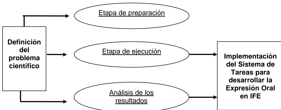
Esquema 1: Etapas del proceso investigativo