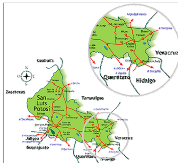
Mapa de la ubicación de la Huasteca potosina.

La extensión total es de 11,409.46 km 2 (18.31% de la superficie total en el estado). Población aproximada 667,000 personas (30% del total de la población estatal); prevalece casi todo el año un clima tropical, lluvioso con temperatura media anual de 26°C; en algunos días del mes de Mayo y en época de zafra de la caña, cuando el calor ambiental se suma al de las quemadas en los cañaverales, se registran temperaturas arriba de los 50 grados; hay una precipitación pluvial de entre 700 y 1000 mm. (INEGI 2006).