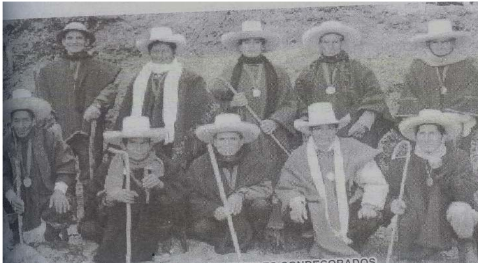
Campesinos ronderos del departamento de Cajamarca