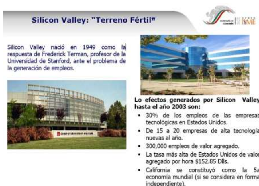
Figura 3 EL SILICON VALLEY

Otra región donde los clústeres del conocimiento han desempeñado un papel relevante en su desarrollo, es la región Francesa de Toulouse, con una población de aproximadamente 450.000 habitantes.