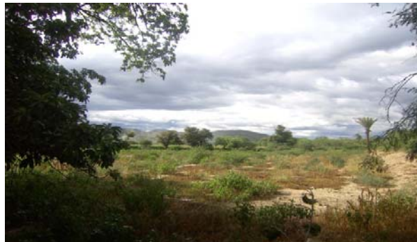
Foto 4. Se observa las diferentes especies de plantas

Fuente: Investigadores de Arquitectura 5 de mayo.