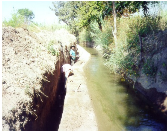
Foto10. Arroyo canalizado