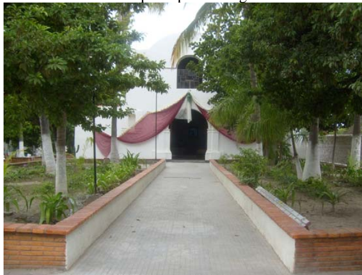
Foto 9. Acceso principal de la iglesia católica

Fuente: Investigadores de Arquitectura 5 de mayo.