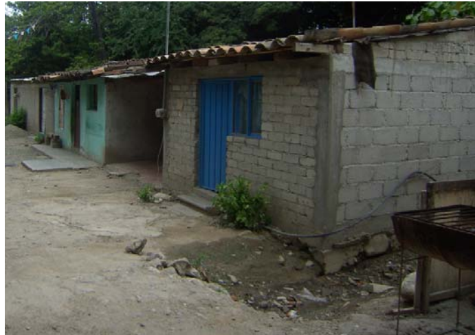
Foto 12. Red de agua potable

Fuente: Investigadores de Arquitectura 5 de mayo.