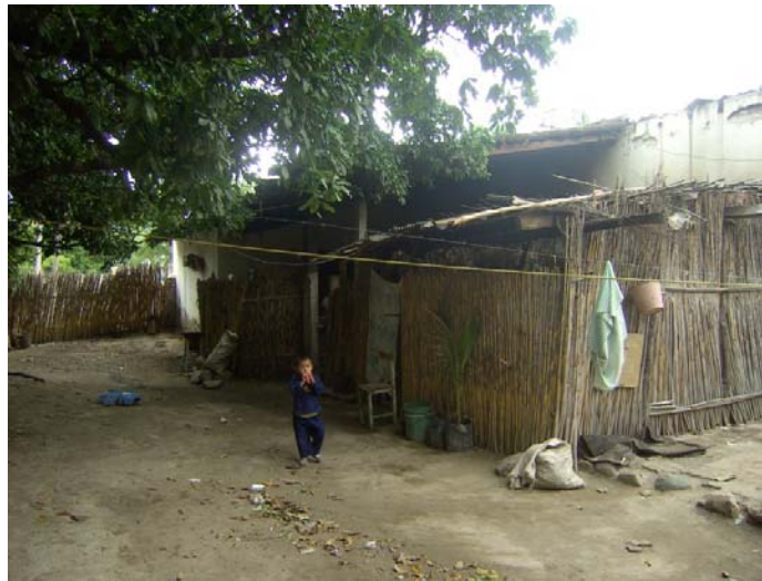
Foto 26. Vivienda hecha a base de carrizo

Fuente: Investigadores de Arquitectura 5 de mayo