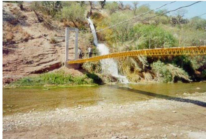
Foto 6. Se observa el río que atraviesa la comunidad

Foto: 6