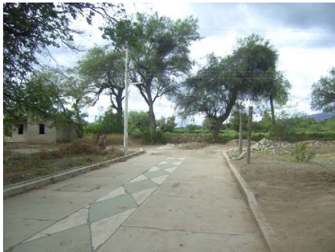
Foto 11. Acceso lateral