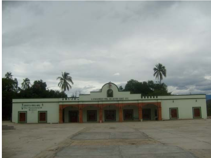
Foto 16. Palacio Municipal

Fuente: Investigadores de Arquitectura 5 de mayo.