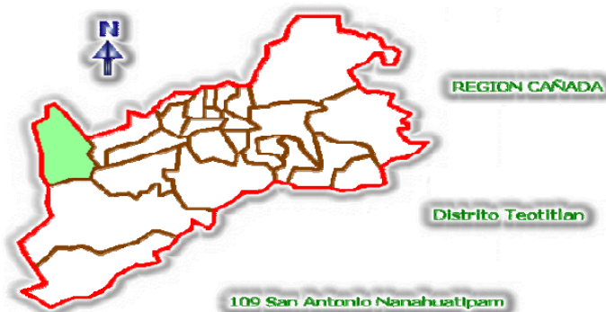
Mapa 1. Macrolocalización