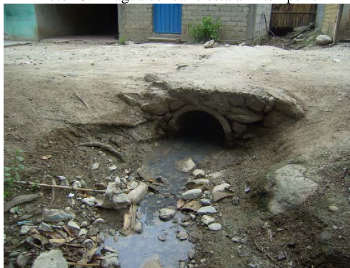
Foto 13. El agua del baño esta al intemperie

Fuente: Investigadores de arquitectura 5 de mayo