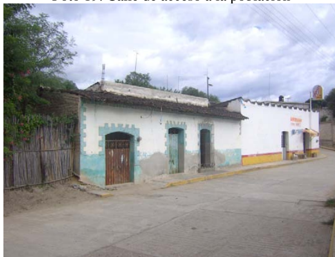
Foto 19. Calle de acceso a la población

Fuente: Investigadores de Arquitectura 5 de mayo.