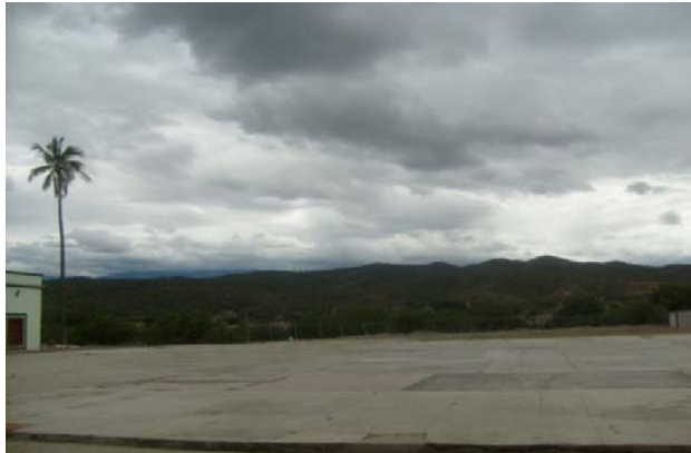
Foto 8. Se observar al fondo de la imagen que el terreno es accidentado.