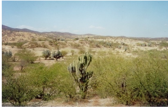
Foto 3. En la zona predomina el cactus.

Fuente: http://www.inafed.gob.mx/work/templates/enciclo/oaxaca/municipios/20545a.htm