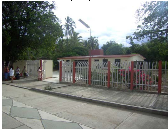
Foto 22. El acceso principal del Centro de Salud

Fuente: Investigadores de Arquitectura 5 de mayo.