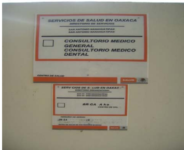
Foto 23. Servicios de salud al pueblo en general