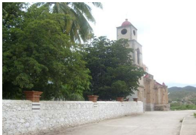
Foto 17. Vista lateral de la Iglesia del pueblo

Fuente: Investigadores de Arquitectura 5 de mayo.