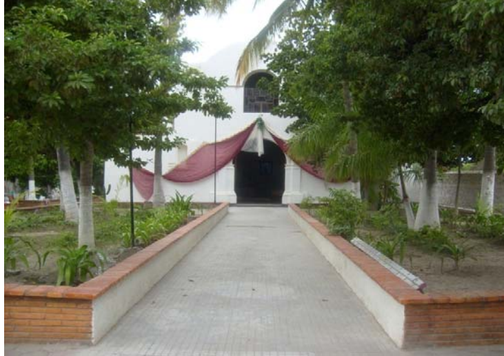
Foto 18. Acceso principal del templo

Fuente: Investigadores de Arquitectura 5 de mayo.