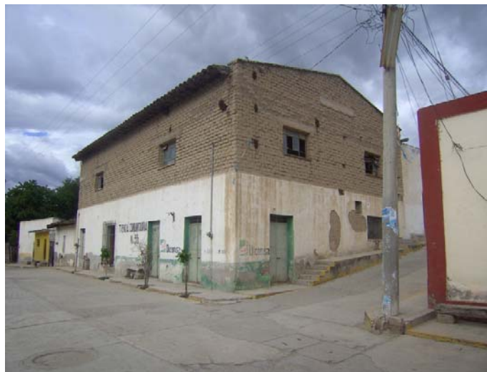
Foto 27. Los muros son de adobe.

Fuente: Investigadores de Arquitectura 5 de mayo.