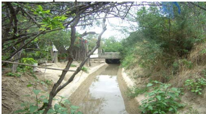
Foto 7. El vital líquido proveniente de los manantiales

Fuente: Investigadores de Arquitectura 5 de mayo.