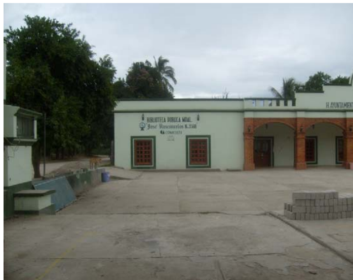
Foto 25. Biblioteca de la Población

Fuente: Investigadores de Arquitectura 5 de mayo.