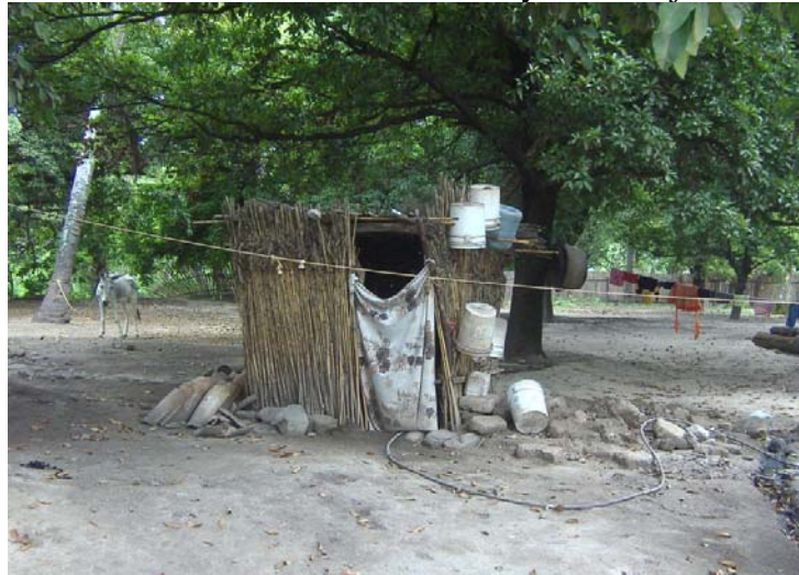
Foto 14. La letrina sustituye al drenaje

Fuente: Investigadores de Arquitectura 5 de mayo