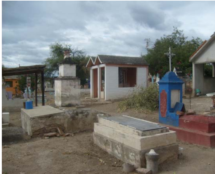
Foto 24. Panteón general del pueblo

Fuente: Investigadores de Arquitectura 5 de mayo.