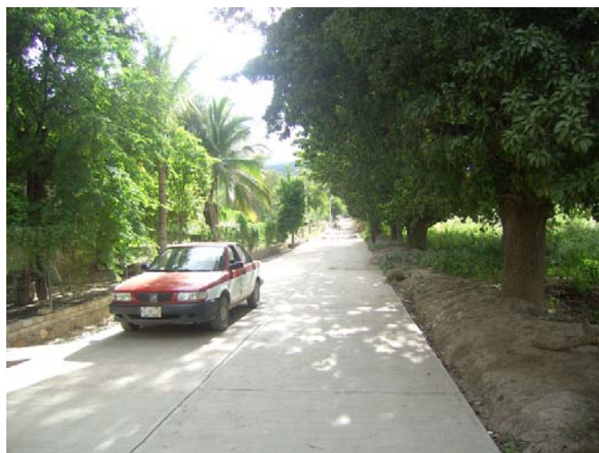
Foto 28. Transporte colectivo

Fuente: Investigadores de Arquitectura 5 de mayo.