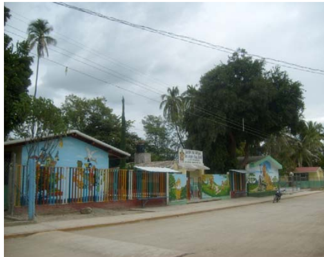
Foto 20. Jardín de niños

Fuente: Investigadores de Arquitectura 5 de mayo.