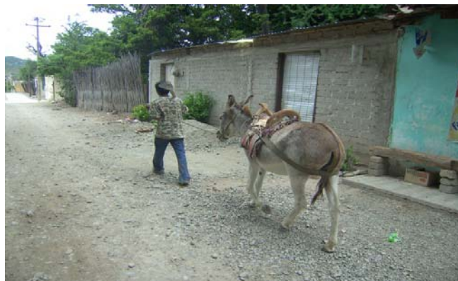
Foto 5. El asno lo utilizan para trabajos de campos, y de carga.

Fuente: Investigadores de Arquitectura 5 de mayo.