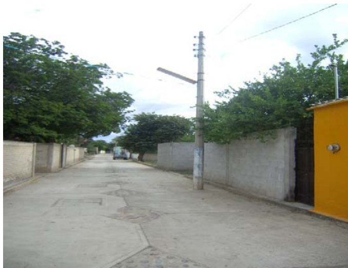
Foto 15. Poste de servicio telefónico.

Fuente: Investigadores de Arquitectura 5 de mayo.