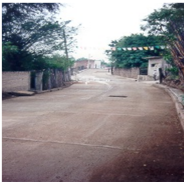
Foto 2. Vista de acceso a la población

Fuente: http://www.inafed.gob.mx/work/templates/enciclo/oaxaca/municipios/20545a.htm