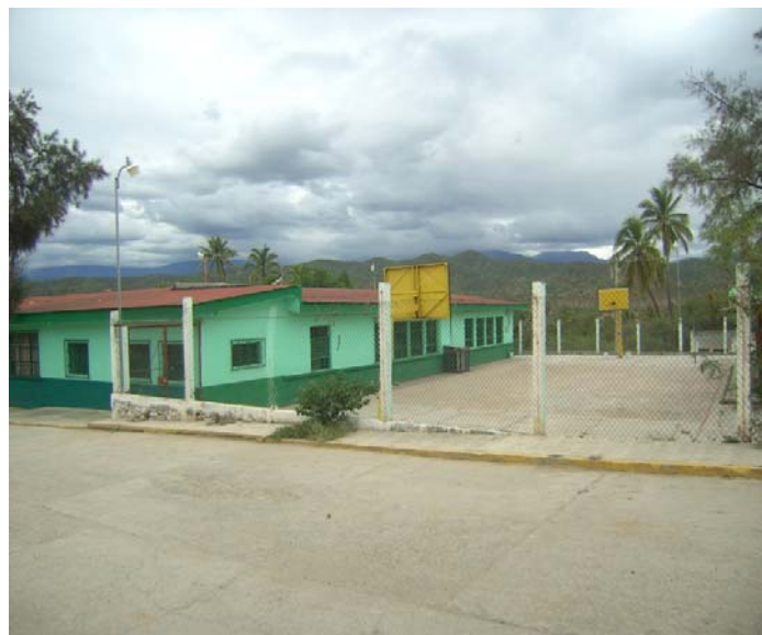
Foto 21. Escuela primaria

Fuente: Investigadores de Arquitectura 5 de mayo.