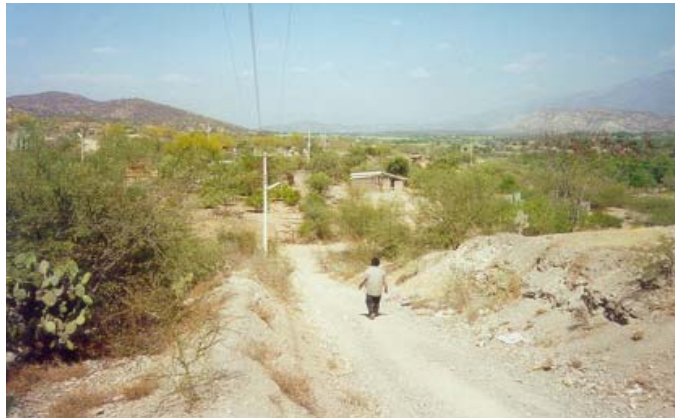
Foto 1. Vista parcial de la población.

Fuente: http://www.inafed.gob.mx/work/templates/enciclo/oaxaca/municipios/20545a.htm