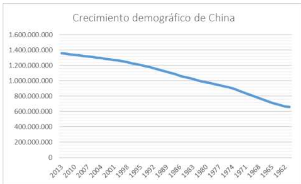
Gráfico 1.1 La reciente evolución demográfica de China.