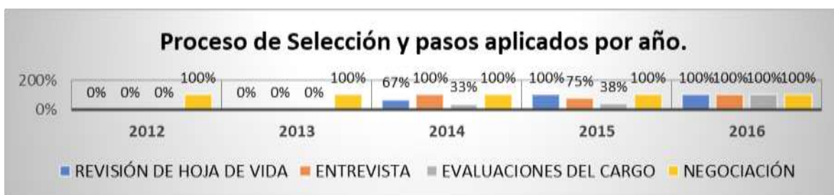
Figura 2: Proceso de Selección y pasos aplicado por año.

En la figura 1 se observa que en los años 2014 y 2015 en los que se realizaron un mayor número de contrataciones la evidencia indica que mientras más aspirantes formaban parte del proceso debido a la urgencia y necesidad, más se omitían los pasos necesarios primando la informalidad. Al no realizar la descripción del puesto o cargo, no hay manera de establecer un filtro que sea eficiente, no existe un perfil del cargo en el que se pueda basar el encargado de talento humano para poder elegir la fuente de reclutamiento y qué información registrar en él.