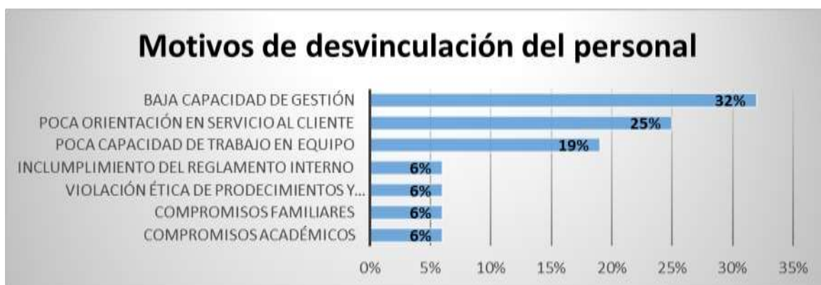
Figura 6: Motivos de desvinculación del personal.

La revisión de las historias laborales de cada colaborador, permitieron identificar las causas de las desvinculaciones en la empresa. En la Figura 6 se puede notar que más del 30% de las desvinculaciones obedecen a una baja calidad de gestión, seguida baja capacidad para atender, con responsabilidad y diligencia, las necesidades del cliente, otro de los motivos fue la poca capacidad en trabajo en equipo, actitudes negativas que impedían el desenvolvimiento del área hacia la consecución de objetivos.