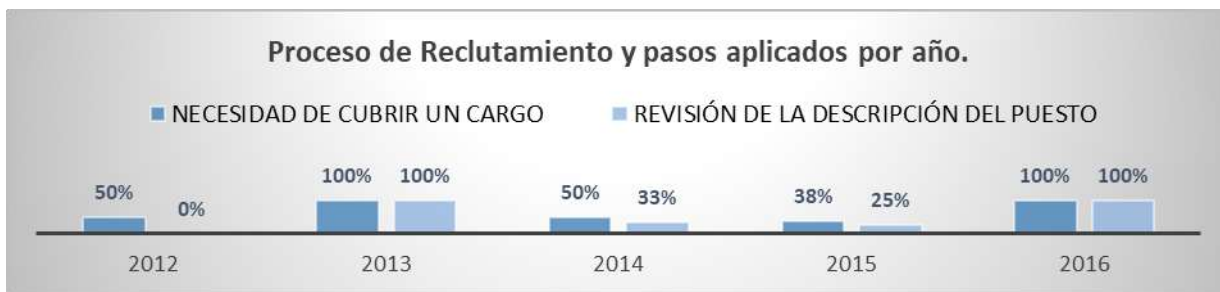
Figura 1: Proceso de Reclutamiento y pasos aplicados por año.

En la figura 1 se observa que en los años 2014 y 2015 en los que se realizaron un mayor número de contrataciones la evidencia indica que mientras más aspirantes formaban parte del proceso debido a la urgencia y necesidad, más se omitían los pasos necesarios primando la informalidad. Al no realizar la descripción del puesto o cargo, no hay manera de establecer un filtro que sea eficiente, no existe un perfil del cargo en el que se pueda basar el encargado de talento humano para poder elegir la fuente de reclutamiento y qué información registrar en él.