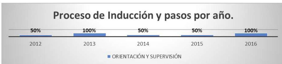
Figura 3: Proceso de Inducción y pasos por año.

En la figura 2 se observa que, en los pasos del proceso de contratación de los años 2014 y 2015, se puso algo más de esmero, lo que pudo haber salvado las omisiones de pasos del proceso de reclutamiento, se observa énfasis en las entrevistas por competencias, aunque no se puso el interés necesario en las evaluaciones de conocimiento.