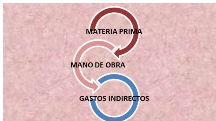
Figura Nº 2: Elementos del costo

Los tres elementos que se deben considerar: