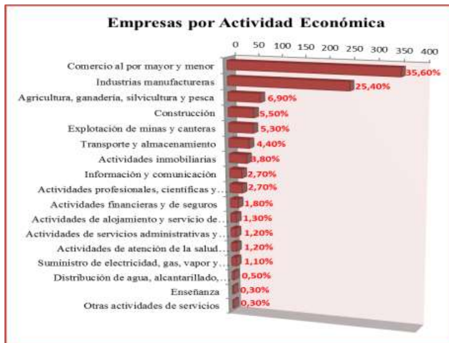
Figura 1. Las 1000 mejores empresas del Ecuador por actividad económica

Nota: Información tomada de Ranking Empresariales Superintendencia de Compañías, 2013.