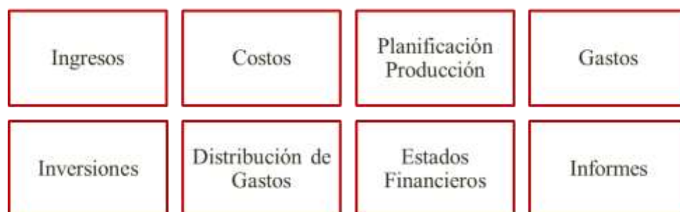
Figura 3. Preparación de los presupuestos requeridos

Es necesario remarcar que un presupuesto es una herramienta financiera que servirá de guía para tener una visión a futuro o hacia adelante de las metas que esperamos alcanzar en determinado tiempo. Los modelos de gestión de rentabilidad basados en presupuestos son creados a la medida para cada empresa pero de manera general los componentes de un modelo para empresas de manufactura pueden contener los siguientes módulos de planificación.