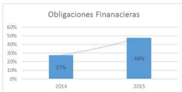
Gráfico 4 Obligaciones Financieras