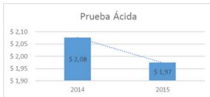
Gráfico 2 Prueba Ácida