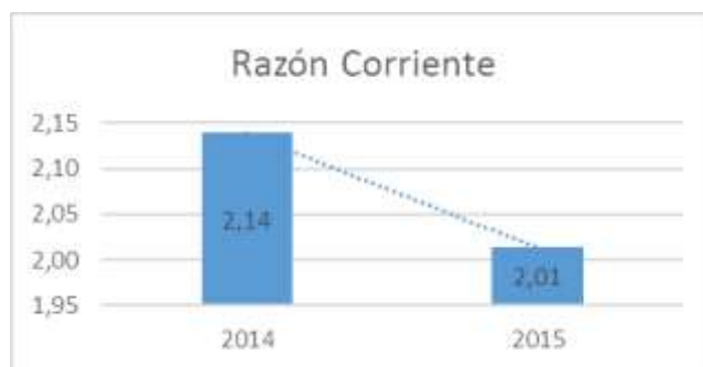
Gráfico 1 Razón Corriente