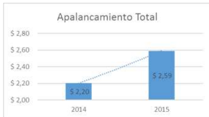
Gráfico 5 Apalancamiento Total