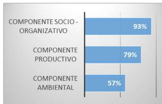
Tabla: Resumen de componentes del año 2013