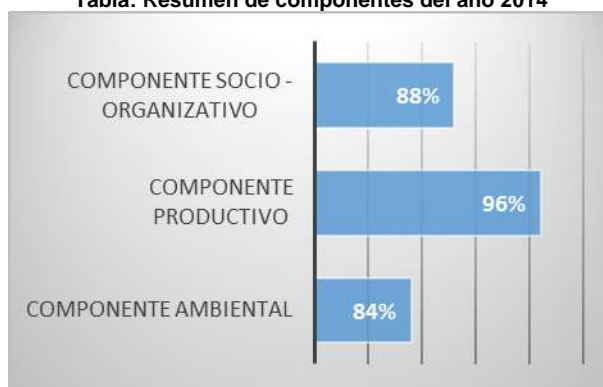
Tabla: Resumen de componentes del año 2014

El componente organizativo en el 2014 crea una estructura planificada para trabajar en los planes estratégicos obteniendo resultados positivos en la socialización de reglamentos y estatutos a través de los talleres y capacitaciones; logrando mejorar las funciones administrativas.