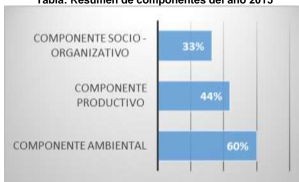
Tabla: Resumen de componentes del año 2015

En el componente socio organizacional las comunidades han realizado un avance considerable en la elaboración del manual de normas y procedimientos administrativos. Pero llama la atención que las capacitaciones, rediciones de cuentas y los intercambios de experiencias no se ha cumplido su objetivo planteado siendo este el año el más problemático ya que todas las decisiones afectaron al desarrollo administrativo de la UNOCANT.