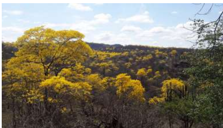
Figura 2. Florecimiento de los Guayacanes