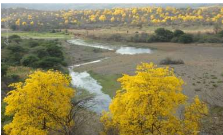
Figura 3. Vista Florecimiento de los Guayacanes