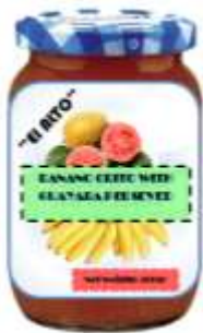
Figura 1. Producto terminado

La conserva de banano orito con guayaba, es un alimento que se vende de manera recurrente en sitio “El Alto”, cantón Río verde, provincia de Esmeraldas; goza de gran popularidad por su excelente sabor y textura. Esta es elaborada en condiciones óptimas para el consumo por un largo periodo de tiempo, por lo general por un lapso de un año en un lugar fresco y seco.