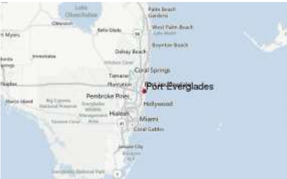
Figura 5. Ubicación geográfica Port Everglades