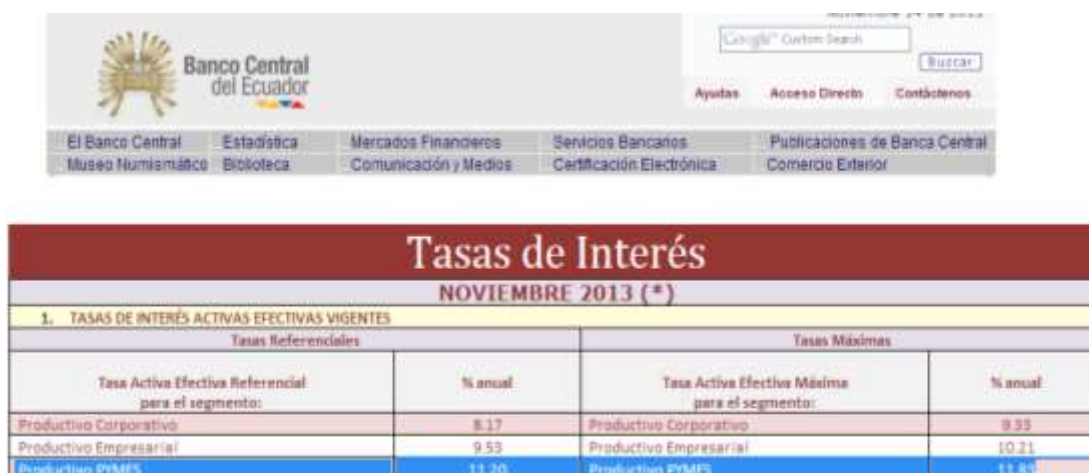
GRÁFICO Nº 4 Tasa de interés Banco del Ecuador.

La inversión de activos se realizará mediante apalancamiento bancario a 3 años plazo, dentro del cual se ha decidió tomar la tabla de interés máximo establecido por el Banco Central del Ecuador a créditos de inversión.