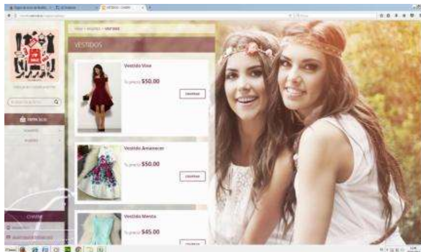
GRÁFICO N° 3 Captura de Pantalla n° 3 Página CHARM