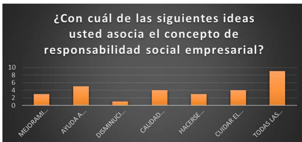
GRAFICO 2: IDEAS ASOCIADAS AL CONCEPTO DE RSE