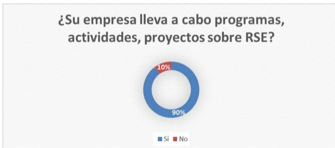
GRÁFICO 3: PRACTICA DE PROGRAMAS, ACTIVIDADES O PROYECTOS DE RSE