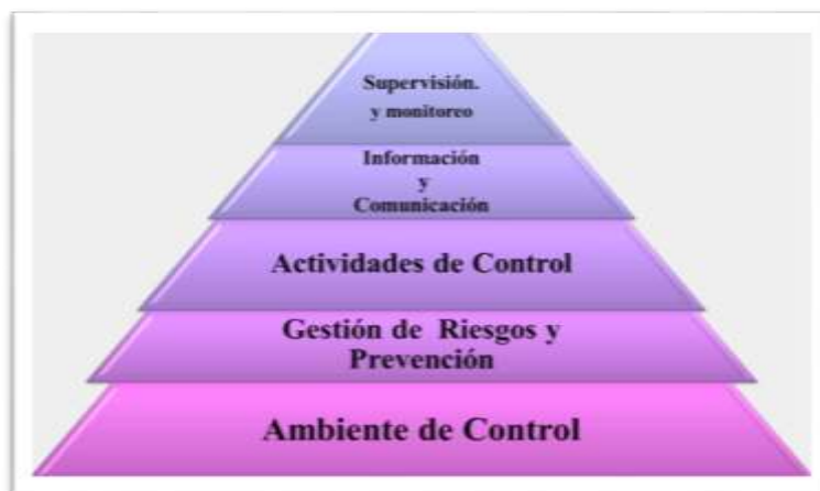
Figura 2. Componentes del sistema de control interno

El control interno además, está constituido por componentes interrelacionados, derivados de la forma de gestionar la organización, como se muestra en la siguiente figura 2: