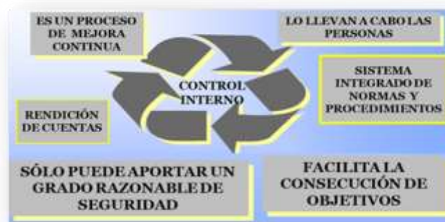
Figura 1. Sistema de control interno

El primer aspecto clave de la definición propuesta es que se trata de un proceso. En consecuencia los controles internos no deben ser hechos o mecanismos aislados, o decretos de la dirección, sino una serie de acciones, cambios o funciones que, en conjunto, conducen a cierto fin o resultado. Esto por sí solo extiende el concepto de control interno más allá de la noción tradicional de controles financieros, para convertir el control interno en un sistema integrado de materiales, equipo, procedimientos y personas. Esto se resume en la siguiente figura: