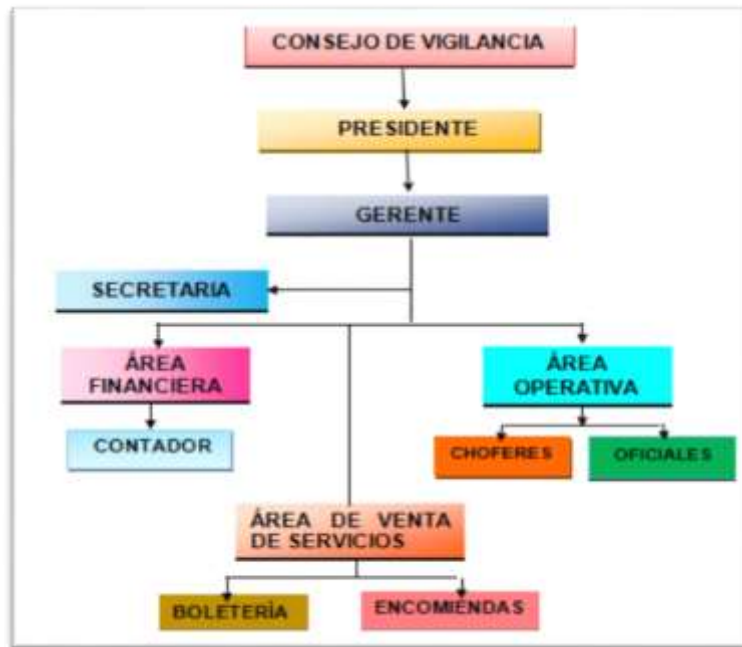
Figura 2. Estructura organizacional de la cooperativa

La Cooperativa de Transporte Zaracay se maneja mediante la siguiente estructura organizacional el cual está comprendido por el consejo de vigilancia que es la cabeza principal de la empresa seguido por el presidente de la Cooperativa el gerente con su respectiva secretaria y de ahí se despliegan las áreas financiera con su respectivo contador, el área operativa con los choferes y oficiales y el área de venta que comprende a boletería encomienda, como se muestra en la figura 2: