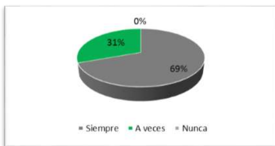
Gráfico 1. Planificación de las actividades a realizar

mientras que el 38% no se ha cumplido satisfactoriamente, siendo desfavorable para la empresa ya que ingresó menos dinero de lo planificado, como se muestra en el gráfico siguiente: