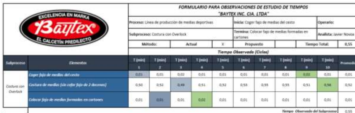
Tabla 2.1 - Tiempo Observado del Subproceso de Costura con Overlock.

A continuación se muestra una tabla a manera de ejemplo de cómo se realizó la toma de tiempos, partiendo de una lectura fija de 10 observaciones.