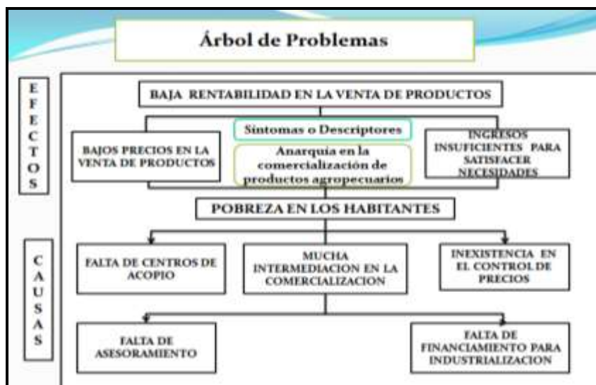
Cuadro No 20