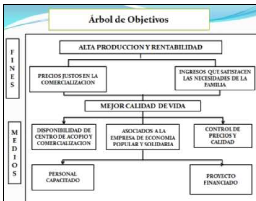
Cuadro No 21

Igualmente se expone las posibles soluciones en el “Árbol de Objetivos” según el siguiente cuadro: