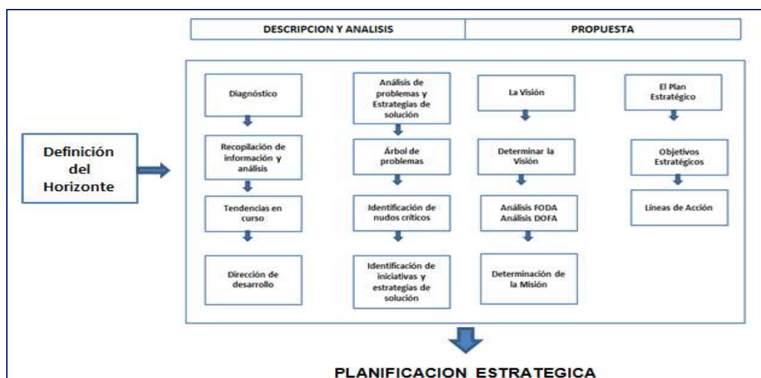
Cuadro No 1

Este equipo de trabajo a más de establecer su correspondiente agenda; se comprometió a colaborar y cumplir con cada una de sus responsabilidades a fin de llevar a cabo el Plan Estratégico conforme al siguiente cuadro (1):