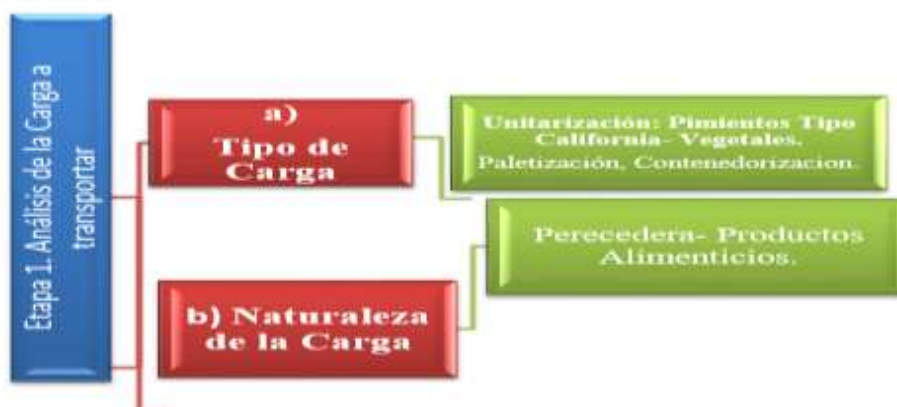
Figura 16. Etapa 1 Naturaleza y Tipo de carga