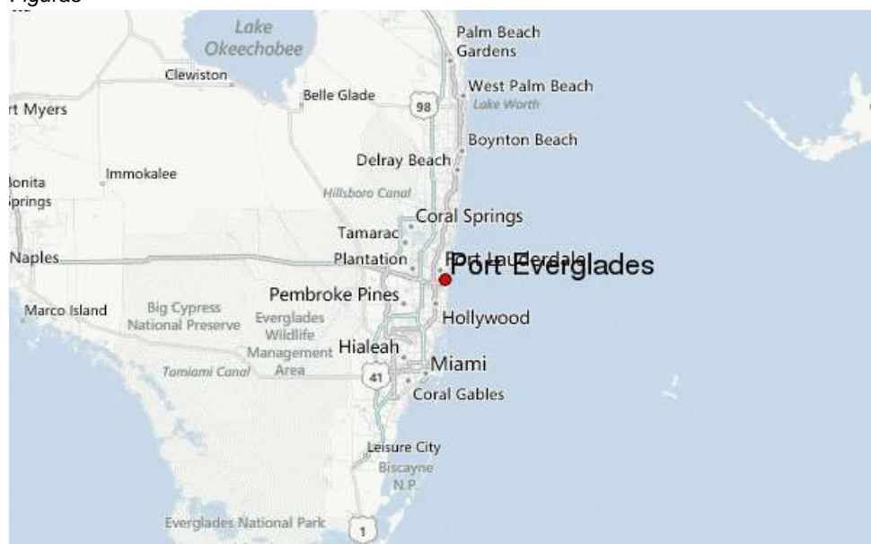
Figura 1. Ubicación de Port Everglades