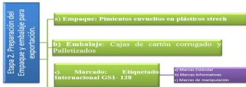
Figura 17. Etapa 2 Empaque y embalaje de pimientos