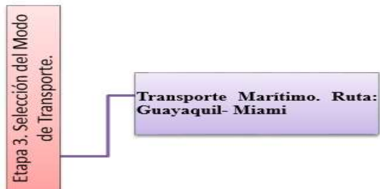
Figura 16. Etapa 3 Medios de transporte