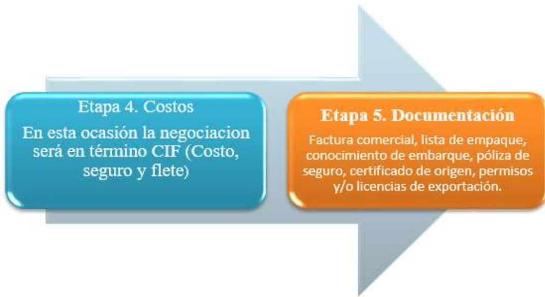
Figura 21. Etapa 4 y 5 Costos y documentación