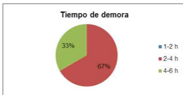
Figura 6 Tiempo de demora

El 67 % del personal acepta que demora de 2 – 4 horas, mientras el 33% lo hace de 4 – 6 horas, en realizar su trabajo pero tienen identificado del porque existe tal demora.