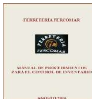
Figura 7 Manual de procedimientos