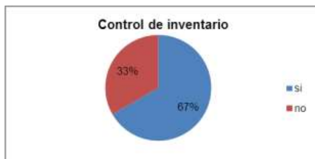
Figura 5 Control de inventario.

El 67% del personal si tiene conocimiento de cómo llevar un control de inventario, ya que cuentan con estudios de bachillerato y muchos de ellos cursan año lectivo en diferentes universidades en carreras afines a su trabajo.