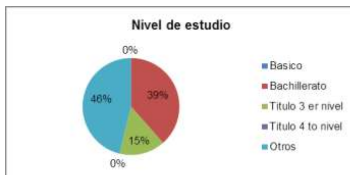
Figura 2 Nivel de estudio

Obtuvimos información sobre el nivel de estudios, el cual nos permite determinar que todos los entrevistados cuentan con los estudios necesarios, la mayoría de ellos ha terminado el bachillerato y han realizado cursos que los capacita para ejercer y realizar el trabajo para el cargo asignado.