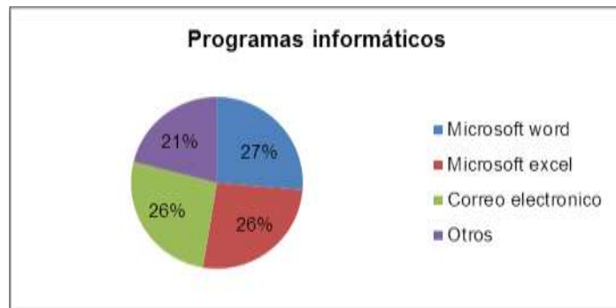
Figura 3 Programas informáticos.