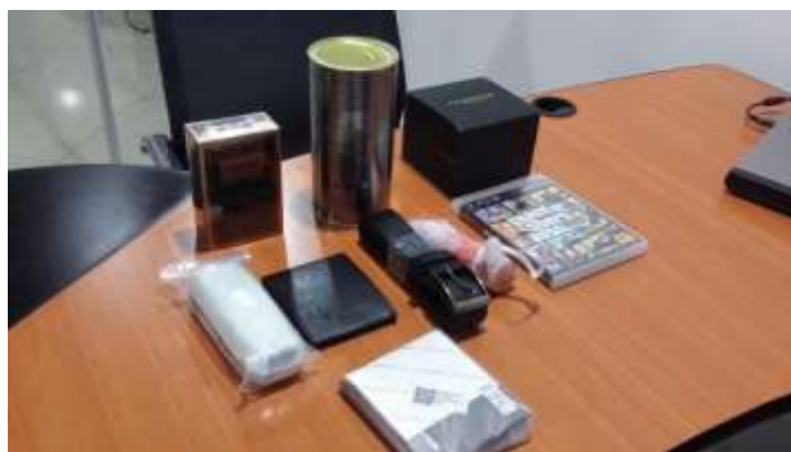
Ilustración 2 Artículos bajo la categoría B