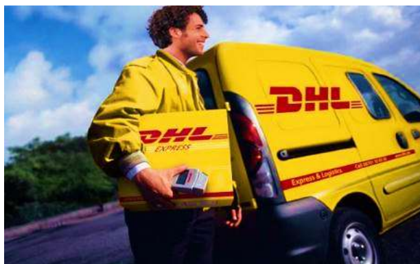
Ilustración 1 Empresa de courier DHL