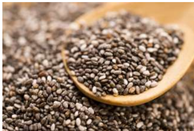
Figura 3. Las semillas de chía fuente de omega 3. Adaptado de: http://www.organicatienda.com/ Elaborado por: Correa Karen.

En la época precolombina, la chía fue uno de los cuatro alimentos básicos para la civilización de América Central (mayas y aztecas), se utilizaban para elaborar medicinas y formaban parte de la alimentación tanto de las personas como de los animales.