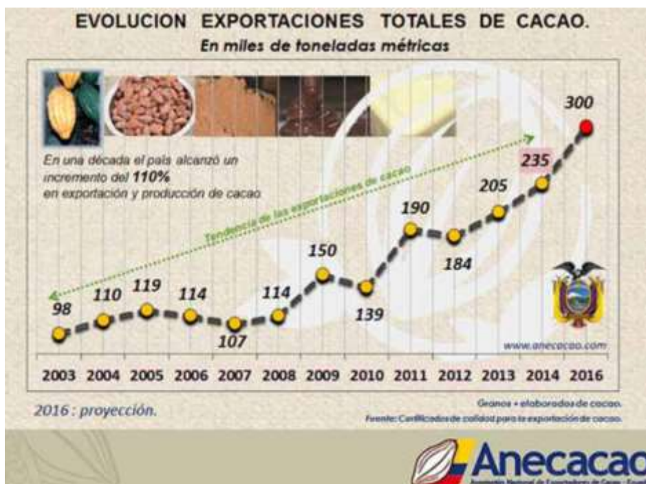
Grafico N° 3: Evolución de las exportaciones de cacao