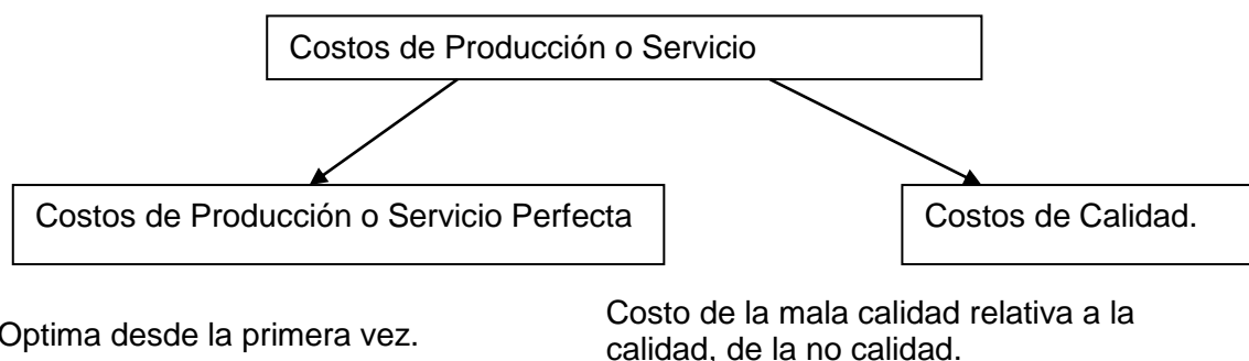
Tabla 3.15. Situación actual de los resultados de la UEB Centro de Beneficio del carbón Vegetal perteneciente a la empresa Cítricos Arimao.

VENTAS – COSTOS DE PRODUCCION = X, Donde