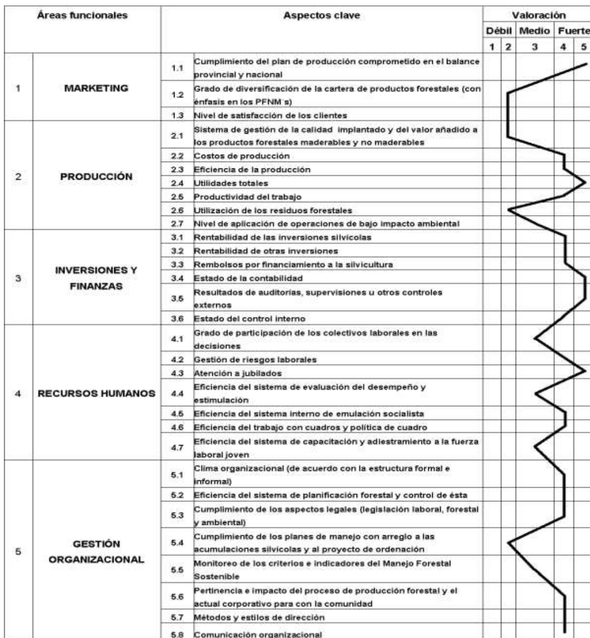
Fig. 11. Modelo para la construcción del perfil estratégico de la empresa.

mejores resultados históricos, para compararse y saber cuáles son las áreas con mayores puntos fuertes y débiles, buscando con este enfoque global aprovechar las sinergias potenciales de las distintas capacidades concretas de la empresa.