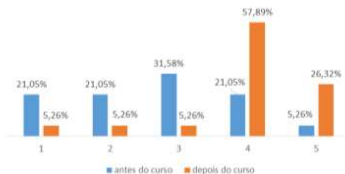
Figura 2 – Vontade de empreender

Com o intuito de verificar a influência do curso de Agronomia para empreender, perguntou-se a vontade de empreender antes e depois de ingressar na Universidade. Em uma escala de 1 a 5, sendo 1 = pouca vontade e 5 = muita vontade, nota-se que 31,58%, ou seja, 6 respondentes afirmam apresentar 3 (três) de vontade de empreender antes de ingressar na Universidade. Ao serem questionados sobre o desejo de empreender após o ingresso na instituição, 11 alunos (57,89%), demonstraram apresentar 4 (quatro) de vontade de empreender, seguido dos que apresentam 5 (cinco) de vontade, os quais representam 26,32%, ou seja, 5 respondentes (Figura 2).