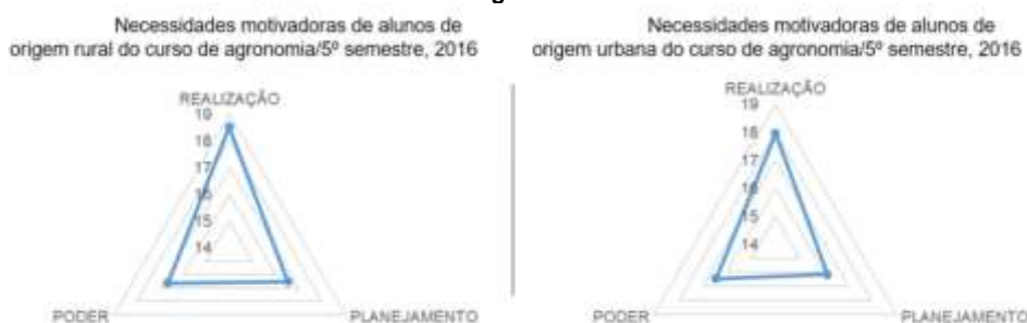
Figura 5- Necessidades motivadoras dos alunos de origem rural e urbana

O modelo proposto por McClelland divide as CCE's em três grupos de necessidades motivadoras, as quais são: realização, planejamento e poder. Nesse sentido a figura 5 representa essas necessidades motivadoras nos alunos de agronomia agrupadas por origem rural e urbana.