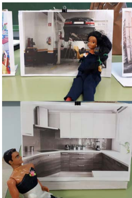
Figura 4. Selección de algunos trabajos del IES Peña del Águila (Jaén).

estéticamente resulta bueno por ser una copia del vídeo de Frau, es interesante porque demuestran haber captado el concepto al introducir la voz. Este trabajo ha sido presentado por parte del centro a un concurso de creación joven.