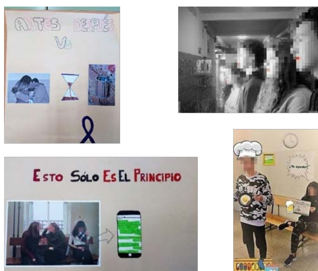
Figura 1. Selección de algunos trabajos del IES Virgen del Carmen (Jaén). ii .

Los trabajos del IES Fuentenueva fueron menos visuales. Un estudiante realizó un ensayo sobre la homosexualidad, redactado como una entrevista de preguntas y respuestas a una amiga suya con un breve comentario personal, si bien no es esto lo que se pedía, pues el proyecto trata de mejorar la cultura visual del alumnado, al menos el estudiante quiso realizar un trabajo a diferencia de algunos del centro anteriormente tratado, que no llegaron a hacer nada. Por otro lado, un grupo de seis estudiantes, algunos disfrazados y con pelucas, realizaron un video donde leían frases sobre la igualdad que habían escrito los compañeros, mientras el resto escucha, después, en un escenario de marionetas se dio lectura a un cuento sobre una princesa rosa que va descubriendo otros colores. El nivel artístico o estético no puede valorarse ya que no está presente. En cuanto al contenido, la lectura de las frases es correcta y su contenido también, los disfraces se explican porque pretenden dirigirse a un público infantil.