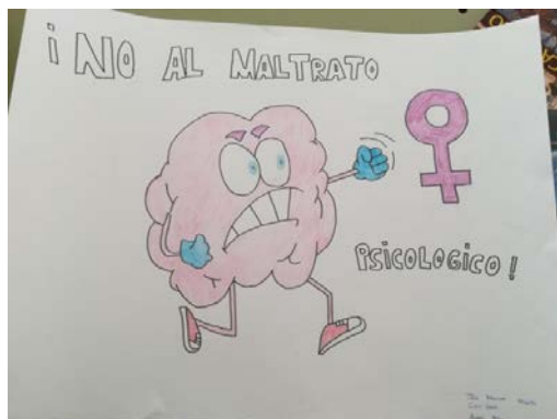
Figura 3. Selección de algunos trabajos del IES Vera Cruz (Jaén).

Probablemente, los trabajos más interesantes sean los presentados en el IES Peña del Águila (Mancha Real, Jaén). En el primer trabajo, sobre una cartulina azul con el título 'Feminismo', se presentan ocho fotografías de carteles con frases feministas como: 'nunca llamaré puta a otra mujer', 'dejar de trabajar para cuidar a los niños será una elección no una presión', 'nunca arriesgaré mi salud por alcanzar un estereotipo de belleza', etc. Al mismo tiempo, sobre una cartulina roja con el título 'Machismo', se presentan ocho fotografías de carteles con frases machistas como: 'vestida así pareces una puta', 'peleas como una mujer', 'estás algo nerviosa ¿no estarás en unos de esos días?', etc. El segundo grupo presentó una cartulina naranja, con el título "si la sangre es de una mujer maltratada la herida es de todas", a modo de collage, se presentan frases y motivos relacionados con la violencia de género como: la explotación sexual, maltrato doméstico o violencia sexual. Si bien no presenta un alto grado de creatividad o artísticidad, al menos han trabajado el tema y han comprendido ciertos mensajes importantes.