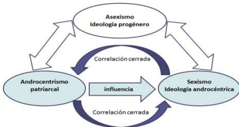
Figura 1. Supuesto arratico. Por el igual no, por el contrario.