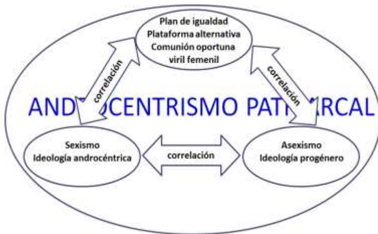
Figura 4. Supuesto con probabilidades. Por el igual, no por el contrario.