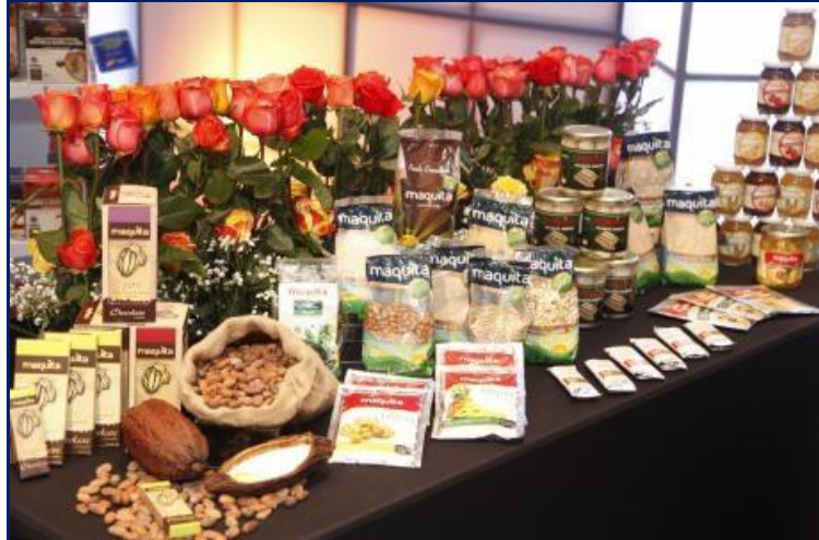
Productos de ecuatorianos de exportación con valor agregado (premiados)

Por otra parte, desde el punto de vista microeconómico, el valor agregado (V.A.) según el Diccionario de Oxford (s.f.) es “el monto por el cual el valor de un producto se incrementa en cada etapa de su producción, excluyendo los costos iniciales”. La FAO lo define como “la diferencia entre lo que cuesta poner un producto de determinadas características en el mercado y lo que el cliente está dispuesto a pagar por él, o lo que éste percibe como valor”, introduciendo en la definición el concepto de calidad.