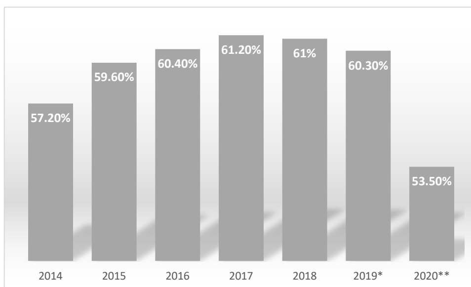
Gráfica 1 Porcentaje de ocupación

En nuestro país, se estableció el "Programa de Monitoreo Hotelero DataTur" que tiene una oportunidad temporal única a nivel internacional, ya que mide de forma semanal los resultados de ocupación en 70 destinos y corredores turísticos.