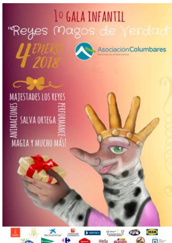
Imagen 2: Cartel del evento

Para el éxito de esta actividad se tuvieron en cuenta diferentes factores y se planificó cuidadosamente, organizando rigurosamente todos los recursos humanos y materiales. Finalmente 200 menores procedentes de diferentes zonas del sur de la Región de Murcia recibieron el juguete que habían elegido. La entrega de regalos tuvo lugar en un evento muy especial en el que fueron acompañados por sus familias y dónde se realizó un espectáculo dónde el baile, la música, la magia e incluso la ciencia estuvieron presentes y en el cual los niños disfrutaron con sus familias y dónde la emoción, la sorpresa y la alegría de los niños fueron los protagonistas. Debido a que los familiares se encuentran en situación de pobreza, los desplazamientos de los menores y sus familias fueron costeados por la organización.