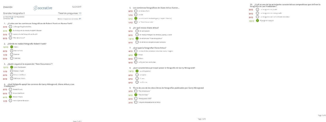
Fig. 1-3. Ejemplo de test realizado con la herramienta Socrative

En las asignaturas de aplicación del PID se realizaron pruebas de nivel, tanto en el inicio de algunos contenidos señalados en los proyectos docentes, como también una vez concluidos estos. Para ello, utilizamos la aplicación Socrative 7 , a través de la cual pudimos medir el nivel de conocimiento previo del alumnado sobre determinadas cuestiones relativas a los temas que iban a ser trabajados en el aula. De la misma manera, el lógico avance, consecuencia de la incorporación de conocimientos tras haber trabajado los temas, también pudo ser comprobado a su conclusión. La interacción que proporciona Socrative nos permitió realizar la lectura e interpretación de una parte de la información objetiva una vez concluidos los test. Con ello, fuimos capaces de detectar dudas, dificultades y posibles carencias formativas sobre algunos aspectos de los contenidos. Así, pudimos resolver, in situ , algunos de estos problemas, además de ocuparnos en mejorar el esquema de trabajo de los contenidos posteriores. En ningún caso, los resultados de estos test sirvieron para evaluar y, posteriormente, calificar al alumnado en las asignaturas (Figs. 1-3).