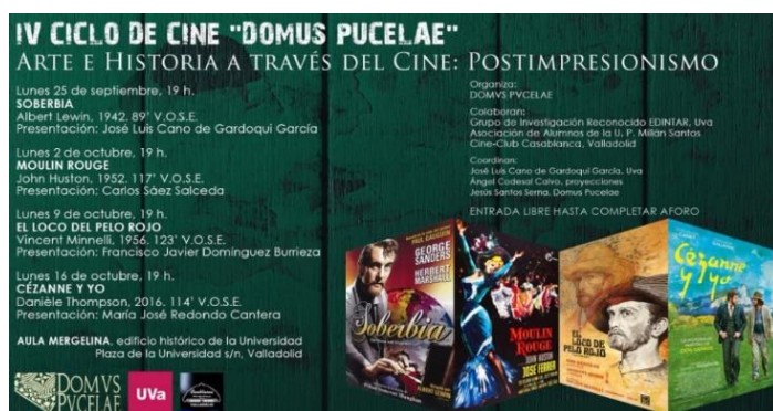
Fig. 4. Cartel del ciclo de Cine