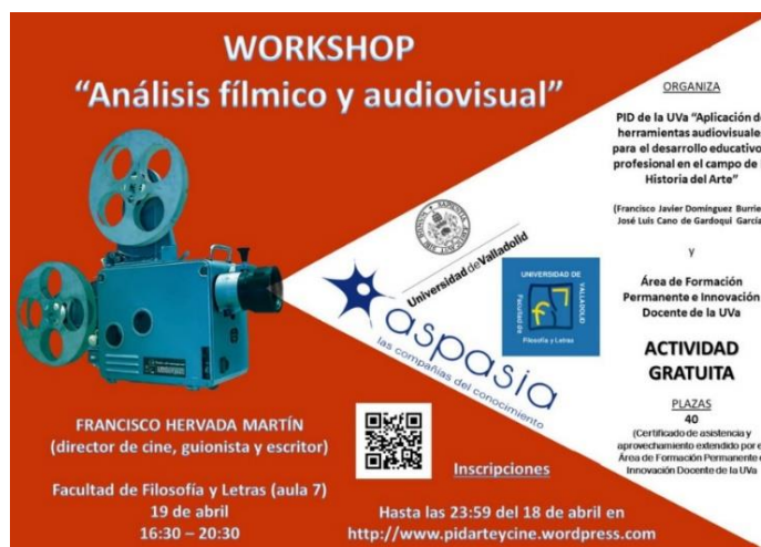
Fig. 7. Cartel del workshop “Análisis fílmico y audiovisual”