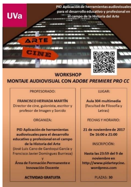
Fig. 6. Cartel del workshop “Montaje audiovisual con Adobe Premiere Pro CC ”

- “Análisis fílmico y audiovisual” (Facultad de Filosofía y Letras de la UVA, abril de 2018) (Fig. 7). También fue dirigido por el miembro del PID Francisco Hervada Martín bajo el método docente flipped classroom . Cada participante accedió a un fragmento de la película Léolo (Jean-Claude Lauzon, 1992) con el fin de ser analizado siguiendo las pautas propuestas por el formador mediante una plantilla elaborada al efecto. En este sentido, pretendimos que el alumnado comprendiese las relaciones entre el lenguaje audiovisual y la Historia del Arte, y con ello que fuera capaz de desarrollar un espíritu crítico y analítico, teniendo en cuenta la multidisciplinariedad de los lenguajes artísticos, así como las diferentes formas de expresión 9 .