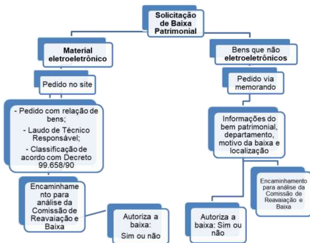
Figura 2 - Processo de solicitação de baixa patrimonial