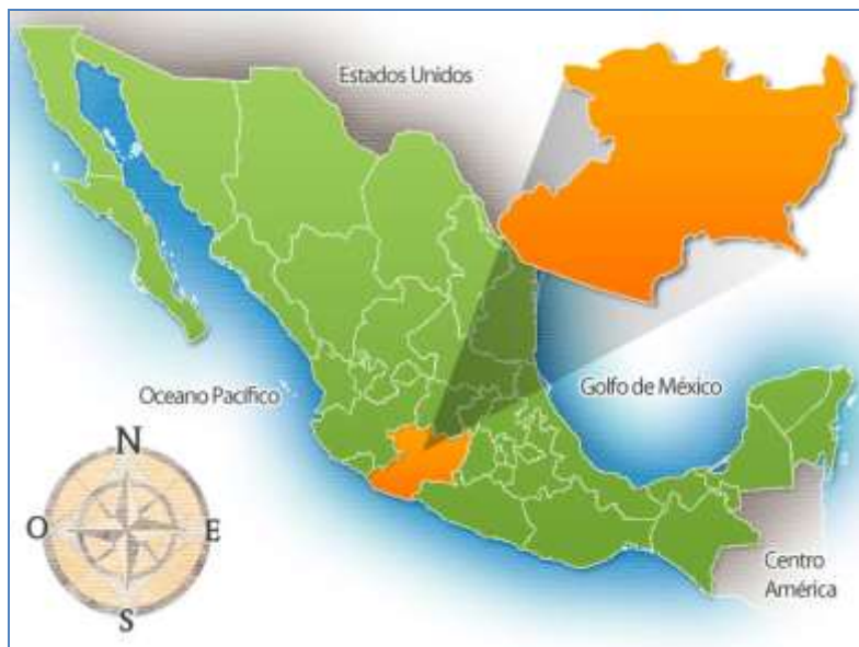
Mapa 1. Localización del Estado de Michoacán

Michoacán está ubicado (mapa 1) en la región oeste del país, limitando al norte con Colima, Jalisco y Guanajuato, al noreste con Querétaro, al este con el Estado de México, al sur con el río Balsas que lo separa de Guerrero, y al oeste con el océano Pacífico. Cuenta con una población de 4 584 471 habitantes (INEGI, 2016). Está dividido en 113 municipios y su capital es la ciudad de Morelia.