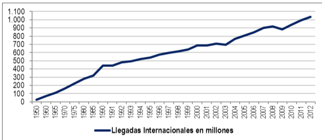
Grafico N. 1 Evolucion de las Llegadas Internacionales (1950-2012)

Fuente: Elaboración Propia, datos provenientes de Organización Mundial del Turismo (OMT) (2012)