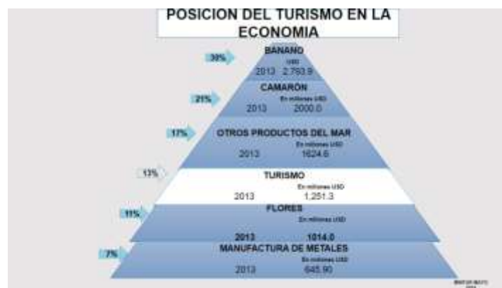
Gráfico N°1 POSICIÓN DEL TURISMO EN LA ECONOMÍA DEL ECUADOR