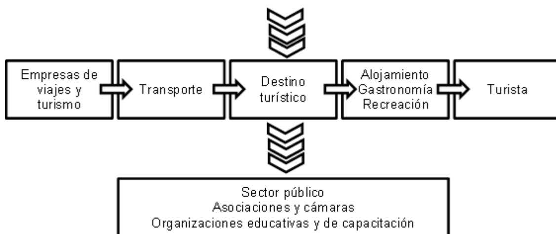
Figura 2: Cadena de Valor Turismo

Así, la cadena de valor turismo se conforma por los siguientes eslabones productivos, que se presentan en la figura 2.