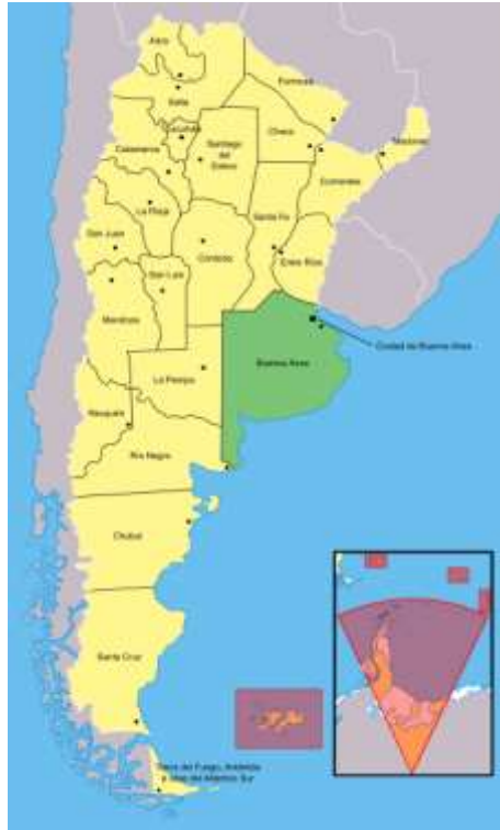
Figura 3: Mapa de localización de la Provincia de Buenos Aires