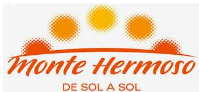
Imagen Nº 2: Logo publicitario de Monte Hermoso